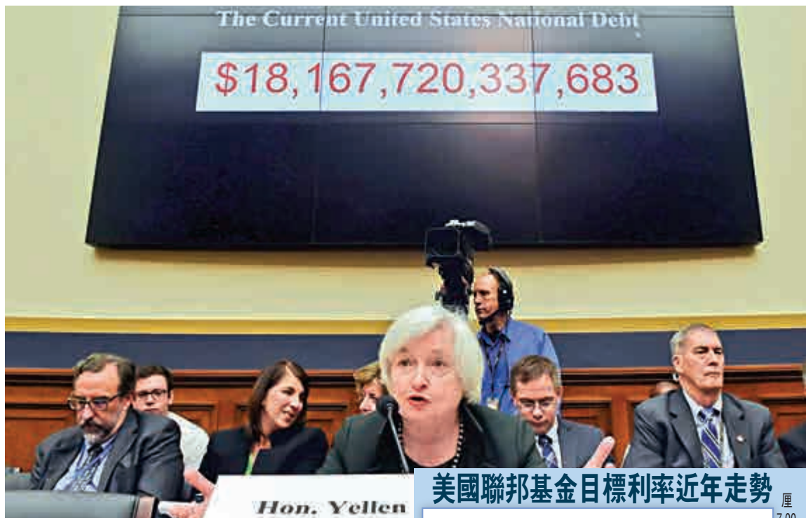
▲美國聯儲局主席耶倫在國會聽證會一再表明，美國經濟發展符合聯儲局所料，今年適宜加息

然而，最令人關注是，希債危機會否對聯儲局貨幣政策有所影響，令到聯儲局推遲實行收緊貨幣政策。美國經濟已經由2008年金融危機中顯著復甦過來，聯儲局現正積極為收緊貨幣政策做功夫，有分析擔心，希債危機和歐元區經濟疲弱，或會導致聯儲局推遲