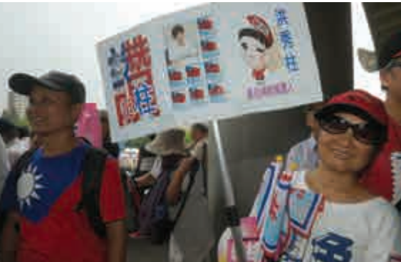
▲國民黨支持者以海報和旗幟為洪秀柱加油打氣

目前蔡英文支持率領先洪秀柱，然而，洪秀柱閩南語順溜、講義氣，台灣南部人就愛這一味。再加上洪秀柱理念清晰，而且她真的很敢說，一吐藍營支持群眾多年來的悶氣。其開放、透明的態度恐怕比台北市長柯文哲有過之而無不及。相較蔡英文模糊又含混的「空心主張」，嗆辣的「實心柱」，2016「辣炒空心菜」，不容小覷。