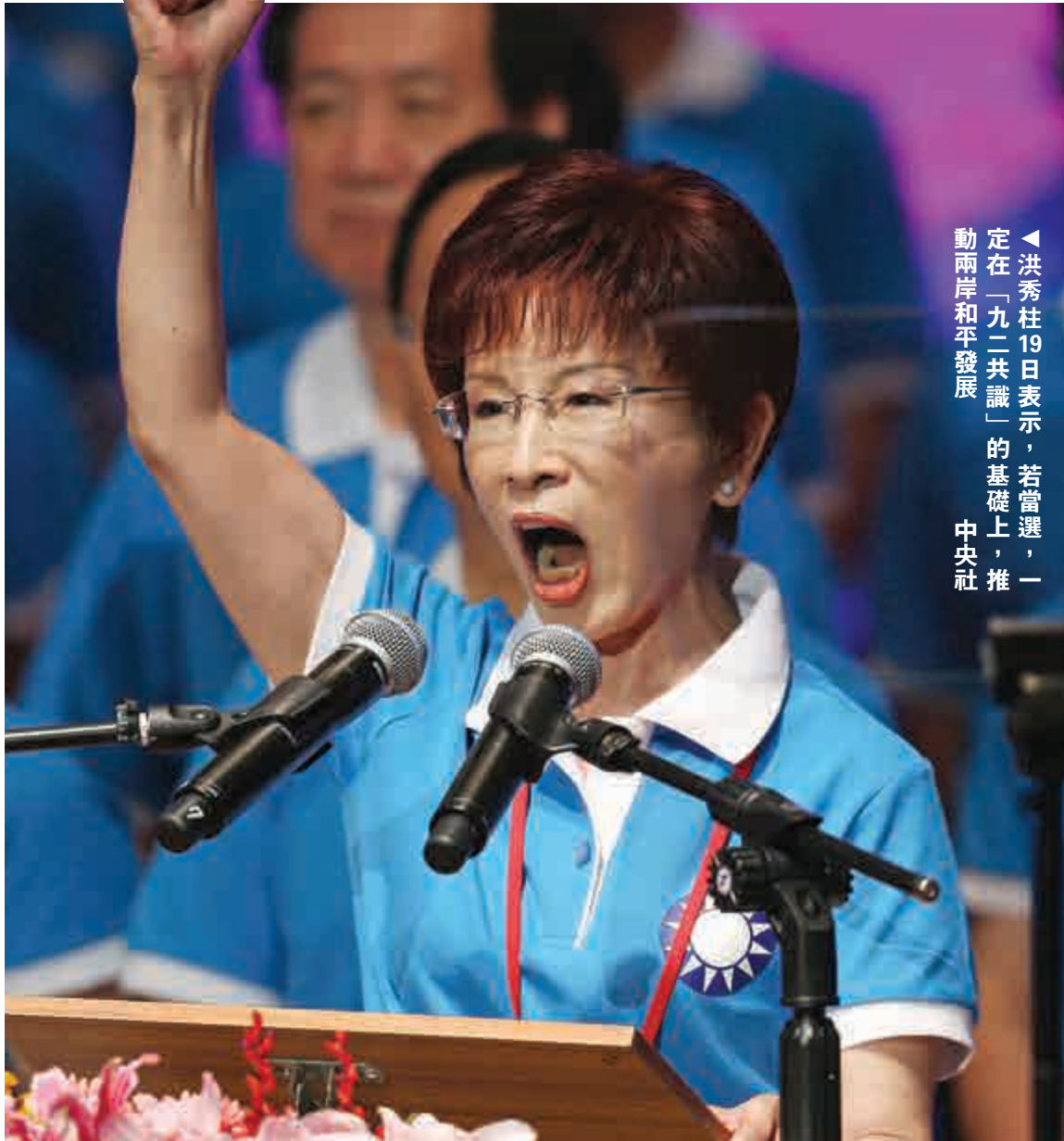
▲洪秀柱19日表示，若當選，一定在「九二共識」的基礎上，推動兩岸和平發展。