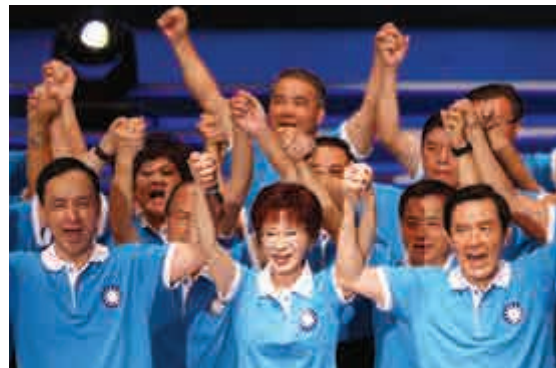
▲馬英九（前右）、國民黨主席朱立倫（前左）為洪秀柱造勢

父是屏東縣枋山鄉楓港當地的望族世家，父親投入房地產、建築業及飯店等行業，所以蔡自幼家境富裕。