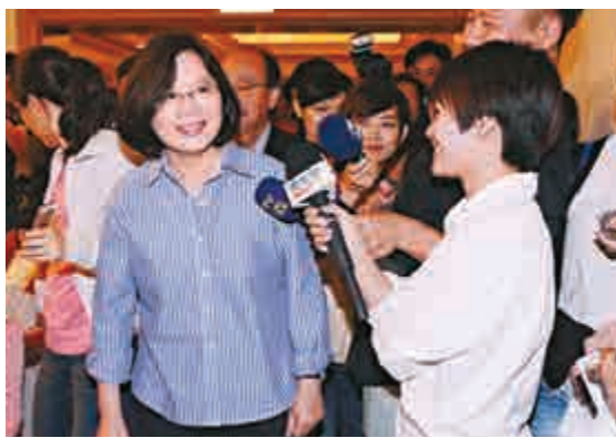
▲蔡英文將打非傳統選戰 資料圖片

先前蔡英文幾乎只有周末幾項輔選行程，或受邀出席論壇會議活動才露面，被媒體形容為「神隱」。