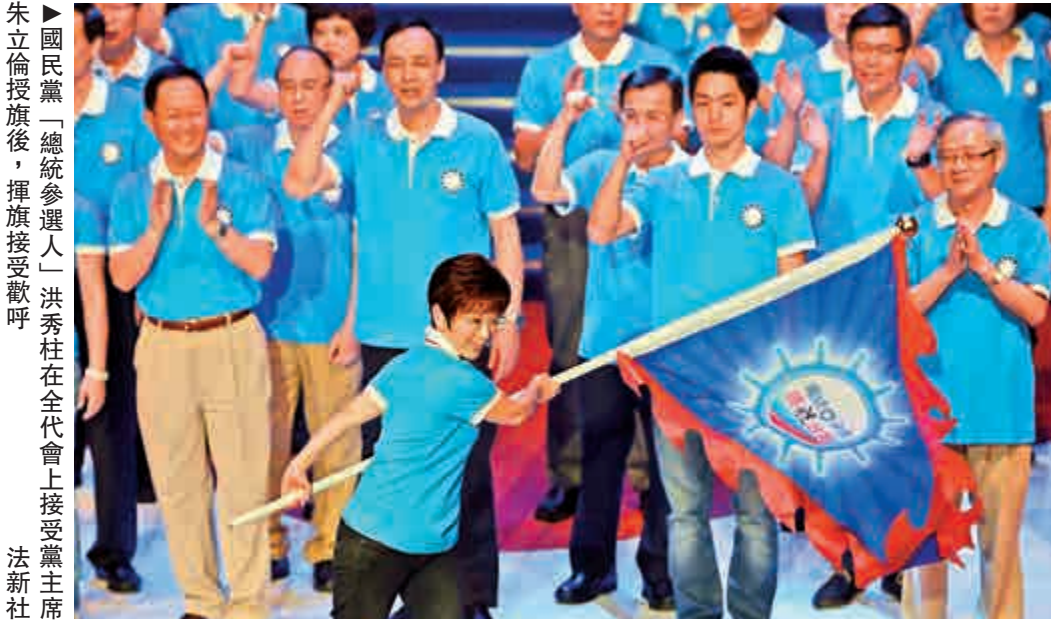
►國民黨「總統參選人」洪秀柱在全代會上接受黨主席馬英九授旗後，揮旗接受歡呼。