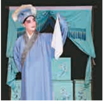
▲俞玖林演出蘇劇經典《花魁記》

【大公報訊】中國戲曲節的壓軸節目由江蘇省蘇州崑劇院及蘇劇團演出。蘇劇與崑劇發展關係密切，首個蘇劇團由蘇灘藝人朱國樑和崑劇藝人周傳瑛、王傳淞等在上世紀四十年代組成。蘇劇唱腔帶彈詞的圓潤軟糯，音樂和表演吸收崑劇的細麗清婉，同時保留蘇灘通俗流暢的格調。 今次蘇州崑劇院首次在港同時呈獻蘇、崑劇，旦角表演藝術家王芳曾得第一代蘇灘老藝人親授，與同是蘇、崑兼擅的著名小生俞玖林將於八月二日合演蘇劇經典《花魁記》。此外，劇院優秀青年演員將於八月二日演出傳統蘇劇及崑劇折子戲，包括蘇劇《精忠記·岳雷招親》和《玉蜻蜓·庵堂認母》，崑劇《繡襦記·打子》和《水滸記·借茶》。