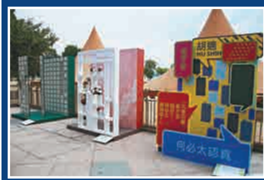
▲時尚拍照區作為公共藝術計劃之一供公眾拍攝留念

位於淺水灣、赤柱及香港仔的三個地標「張愛玲香港之旅」、「胡適牛字遊戲」及「蔡元培漫步過去」已分別揭幕。而紀念蕭紅的「飛鳥三十一」地標以及許地山的地標「樸」的工程將於其後相繼展開，亦會很快與公眾見面。有關詳情可瀏覽www.travelsouth.hk或致電二七六九六六三三查詢。