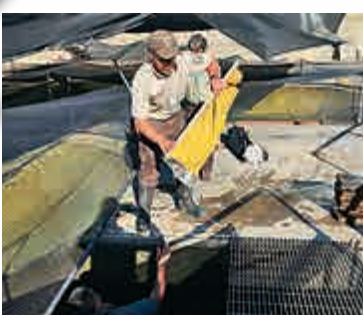
▲工作人員試圖將魚苗移走

【大公報訊】據《波特蘭商業日報》報道：美國俄勒岡州近來有條河水水溫飆升，與以往季節不符，河裡數千條鮭魚因此熱死，聯邦官員7月持續將鮭魚魚苗運往北邊距離160公里的華盛頓州保育中心。 美國魚類暨野生動物管理局官員琺森指出，暖泉河的水溫在這個時節很少高於攝氏21度，今年卻攀升到24.4度，高到足以降低春天孵化的鮭魚幼苗免疫力。他表示，河裡的鮭魚被送走之前，每天約有2000條魚死亡。琺森說：「如果天氣持續炎熱，對魚群恐怕造成更多問題。」 管理局上周搶救出暖泉河保育中心的16萬條鮭魚，管理局稱這是史無前例的作法。俄勒岡與華盛頓兩州的野生動物管理部門都發出罕見的禁釣令。 他們從水溫超過21度的地方將魚群轉運往水溫約攝氏10多度的地點，這個水溫對鮭魚較安全。