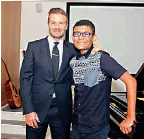
▲碧咸和其資助對象 網上圖片