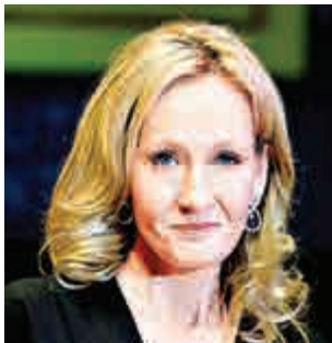
▲《哈利·波特》的作者J·K·羅琳

【大公報訊】據英國《鏡報》報道：英國布里斯托爾一名男子21日打999報警求助，投訴一隻海鷗企圖咬走他手上的三文治。警方周三公開他的電話錄音，批評他浪費警方時間和警力。 在對話中，999報案熱線中心內的接線生保持耐性，聽他講話，嘗試了解究竟發生了什麼事。該名男子很氣忿的嚷嚷，要求警員翻看街上保安攝錄機拍到的片段，證明他沒有講大話。 他對接線生說：「哈囉！我正在布里斯托爾市中心麥當勞門外，其中一隻海鷗企圖咬走我手上的三文治。」接線生插嘴，保持禮貌對他說：「OK，等一等。這與警方有何關係？只是一隻海鷗。」該名男子顯然感到不滿，但隨即掛線。