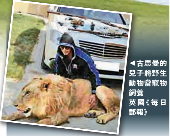
▲古思曼的兒子將野生動物當寵物飼養