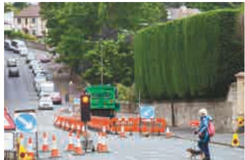
▲J·K·羅琳的家門口交通堵塞 英國《每日郵報》

【大公報訊】據英國《每日郵報》報道：《哈利·波特》的作者J·K·羅琳近日遭到了鄰居的抱怨，她為了修剪自家住宅外的灌木樹籬設置了臨時交通燈，造成車輛擁堵。 報道稱，羅琳住宅外的這堵籬笆牆有30英尺，園丁已經連續工作了3天，對其進行修剪。為了修剪工作順利進行，羅琳給住宅外面設置了臨時的交通信號燈。然而這些信號燈導致車輛排起長隊，給其住宅周邊的交通狀況造成「混亂」，引發了居民們的不滿。 報道稱，這道樹籬的設立，很可能是為了保護羅琳住宅的隱私。然而據稱這些灌木每年會長高3英尺，因而年年都需要修剪。由於該宅邸的規模，每年的修剪工作都成了該鎮的「大型作業」。現在，附近的居民們都想知道這項工程還有多久才能完成。