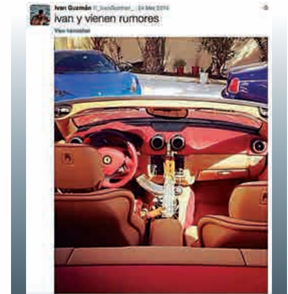
▲古思曼的兒子將AK-47步槍放在法拉利名車內

【大公報訊】據英國《每日郵報》報道：墨西哥大毒梟古思曼（Joaquin「El Chapo」Guzman）月初逃獄後，成為全球頭號通緝犯，至今仍逍遙法外，其長子早前在社交網再取笑墨西哥當局無能，還警告爸爸的仇家要小心，甚至炫耀他的奢華生活，根本不把墨西哥政府放在眼內。 古思曼的四名子女早前在推特，上載名車、派對和將野生動物當寵物飼養的奢華生活照，其中古思曼長子伊萬（Ivan Archivaldo Guzman）上載的一張照片，見到一把AK-47步槍放在法拉利名車內，盡顯霸氣。不過，伊萬強調自己並非父親「毒品王國」的繼承人，重申「他還在發號施令」。 全球頭號毒梟古思曼本月11日再次越獄，從墨西哥一所高度設防監獄逃出，目前下落不明，這是他14年來第二次成功越獄。