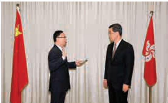
▲新任公務員事務局局長張雲正（左）昨日在行政長官梁振英監誓下宣誓就職

，對他將來工作有很大幫助。他舉出先後擔任郵政署署長及海關關長的經驗，稱曾經與擁有7000人的郵政署10個工會聯繫，了解工會的運作及訴求，亦與紀律部隊前線人員及工會代表對話。