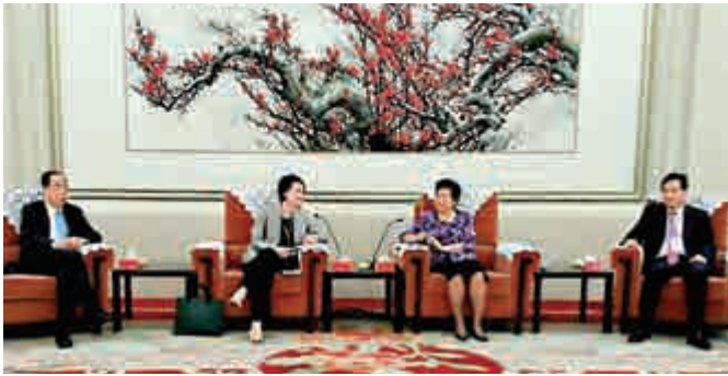
▲發改委副主任何立鋒（左七）會見民建聯訪京團 ▲統戰部副部長林智敏（右二）會見民建聯訪京團