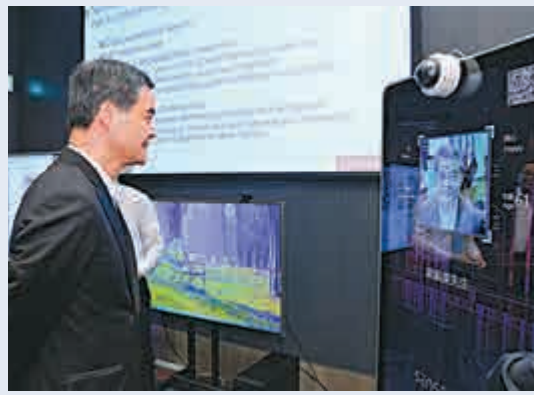
▲梁振英及行會成員參觀資訊通訊科技公司，了解先進電視視覺技術和人臉識別系統

梁振英昨晨到科學園參觀期間，先聽取科學園董事局主席羅范椒芬簡介科學園的最新發展。同行的行政會議成員包括工聯會榮譽會長鄭耀棠、港大校務委員會成員，以及行政長官創新及科技顧問楊偉雄等。