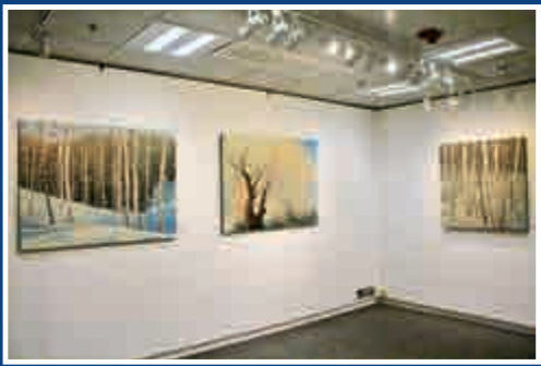
▲「大地」系列現於香港視覺藝術中心展出。