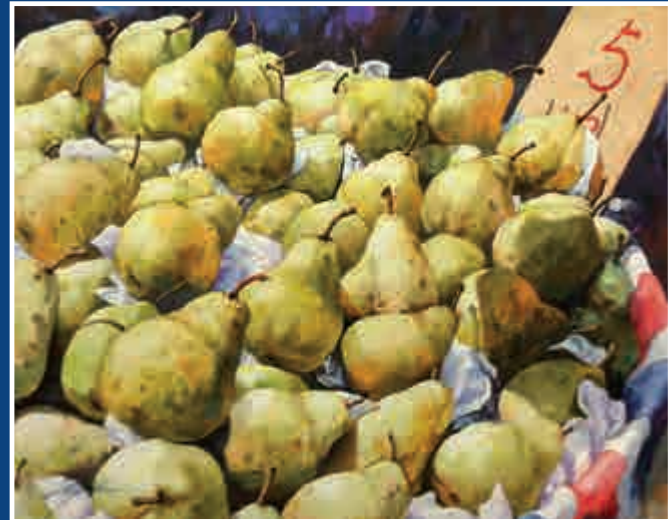
▲《幾元五個？》