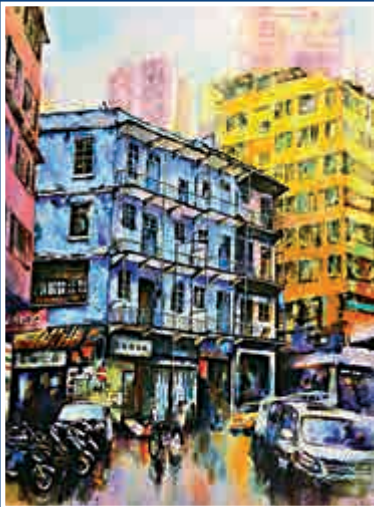
▲《雨過天晴》

有關兩場展覽詳情可瀏覽加華藝廊網頁 http://www.cawahart.com/2015-07-22-07-27/ 或致電九二四三三〇一八查詢。