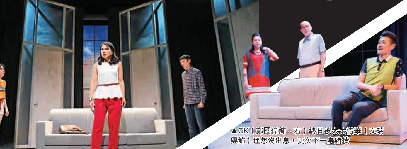
▲CK（鄭國偉飾，右）終日被太太惜華（文瑞興飾）埋怨沒出息，更欠下一身賭債