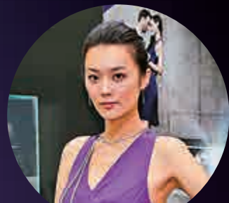
模特兒展示周生生Infini Love Diamond項鍊

現時Infini Love Diamond共推出婚嫁、典雅和Iconic系列三個不同系列；婚嫁系列主要針對結婚訂婚鑽戒而設，外觀設計較為簡約、經典，而又不失莊重華貴；典雅系列是具有紀念價值和值得珍藏的系列，外形設計典雅高貴，款式種類亦趨多元化；Iconic系列是專為現代獨當一面女性而設，具有較強的自我風格，適合現代女士作為自我獎賞或配襯之用。石崢認為Infini Love Diamond三個不同系列的最大共通點，就是同樣採用最完美無瑕的Infini Love Diamond鑲嵌，讓每件鑽飾也能綻放出耀目迷人光芒。石崢續表示，首飾珠寶近年隨着市場轉變，已非單只是作饋贈、紀念用途或重要場合佩戴，相反是走向自用和日常佩戴，而且用家也趨年輕化，不少現代女性也愛買首飾來獎勵自己；面對未來市場走向，石崢預期周生生未來將致力拓展新的銷售平台，隨着電子網絡、手機應用程式等高科技平台普及化，年青營銷市場將大有可為，而這方向亦會成為打後其中一個重要市場。