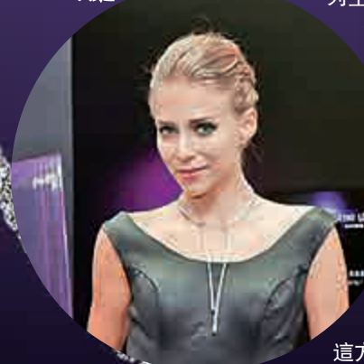
模特兒戴上Infini Love Diamond項鍊

為了展現Infini Love Diamond的璀璨亮麗，周生生特意舉辦這次大型的巡展，讓更多人可以深入了解一顆完美無瑕的頂級鑽石是怎樣形成。巡展分為多個展區，以深入淺出的方式展現Infini Love Diamond的優雅與非凡。除了展出該系列的作品包括象徵永恒愛情的婚嫁系列、採用簡約風格的Iconic系列及深具歐洲古典美的典雅系列外，場內設置了一見難得一見的專業測試儀器，能親身驗證及感受Infini Love Diamond 比一般鑽石更閃耀的光芒及完美對稱的八心八箭圖案。