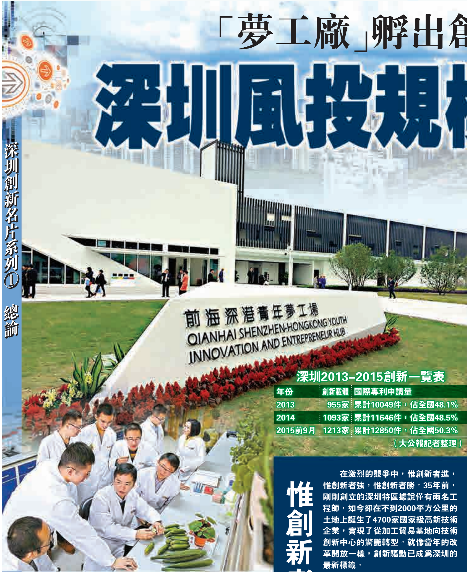
▲深圳農業基因組研究所的專家在工作