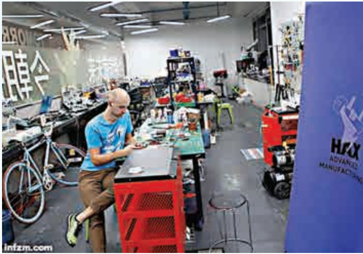
▲一位來深圳華強北創業的美國人

香港一國兩制研究中心總研究主任方舟表示，深圳在如火如荼發展後，有望反哺香港，香港可以借鑒自己國際化環境、知識產權保護的特點做大文章。深圳的企業可以將研發基地設在香港，招攬全球人才。