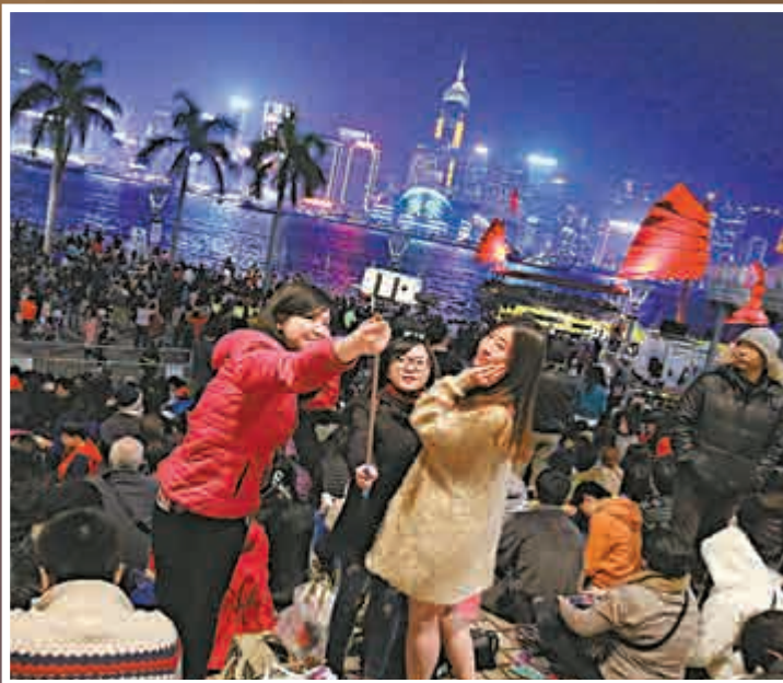
▲入夜後湧至維港兩岸的市民愈來愈多，不少市民悉心打扮，與朋友自拍留念

中環蘭桂坊愈夜愈熱鬧，十時未到已擠滿市民和中外遊客迎接新年。酒吧負責人張先生表示，早於一星期前已有顧客訂位，除夕晚的預約早已滿座，生意較去年升兩至三成，估計與競爭法有關，因為不少商品價格下跌，令市民消費意慾上升，更願意花錢消費。他續指，留意到近年內地遊客雖然下跌，但來自不同國家的旅客上升，特別是日本和韓國的旅客，帶動生意上升。問及新年願望，他希望世界和平，香港各方面減少爭拗，發展經濟。