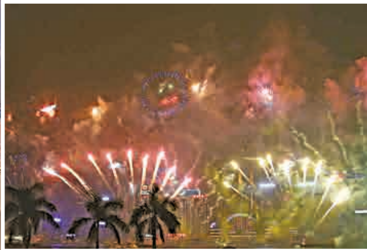
▲維港上空出現多個「笑面」圖案