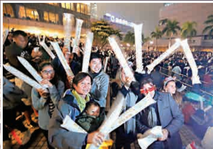
▲向來是觀賞煙火的熱點的尖沙咀海傍，傍晚時分已有數百市民霸定靚位