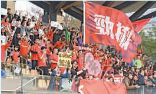
▲九龍灣公園球場氣氛熱烈，香港女足首次在主場獲眾多球迷支持