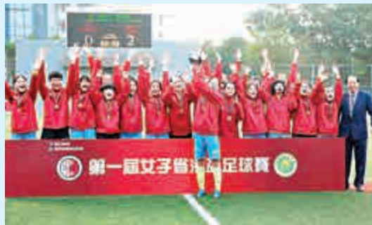
▲廣東女足奪冠，隊員興奮地高舉省港杯