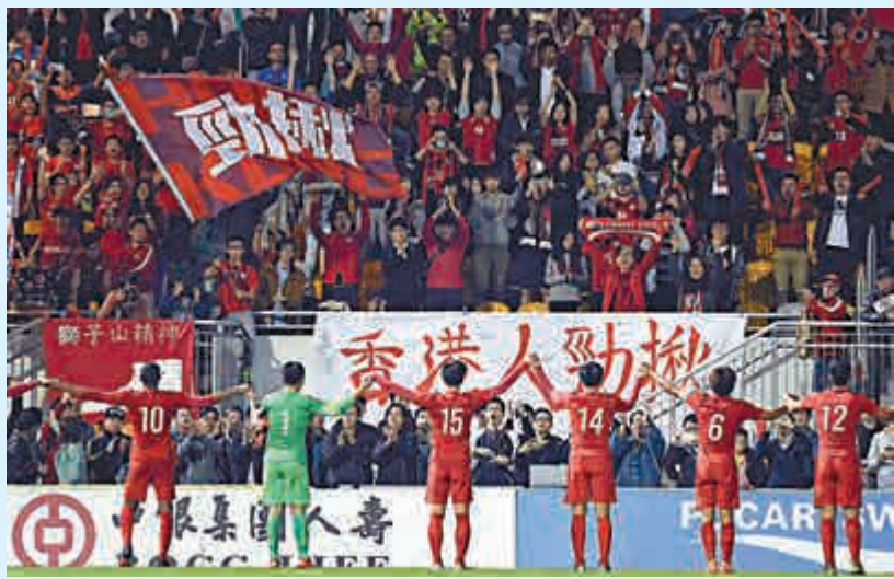
▶香港隊在除夕夜踢了一場好波，賽後向觀眾謝幕