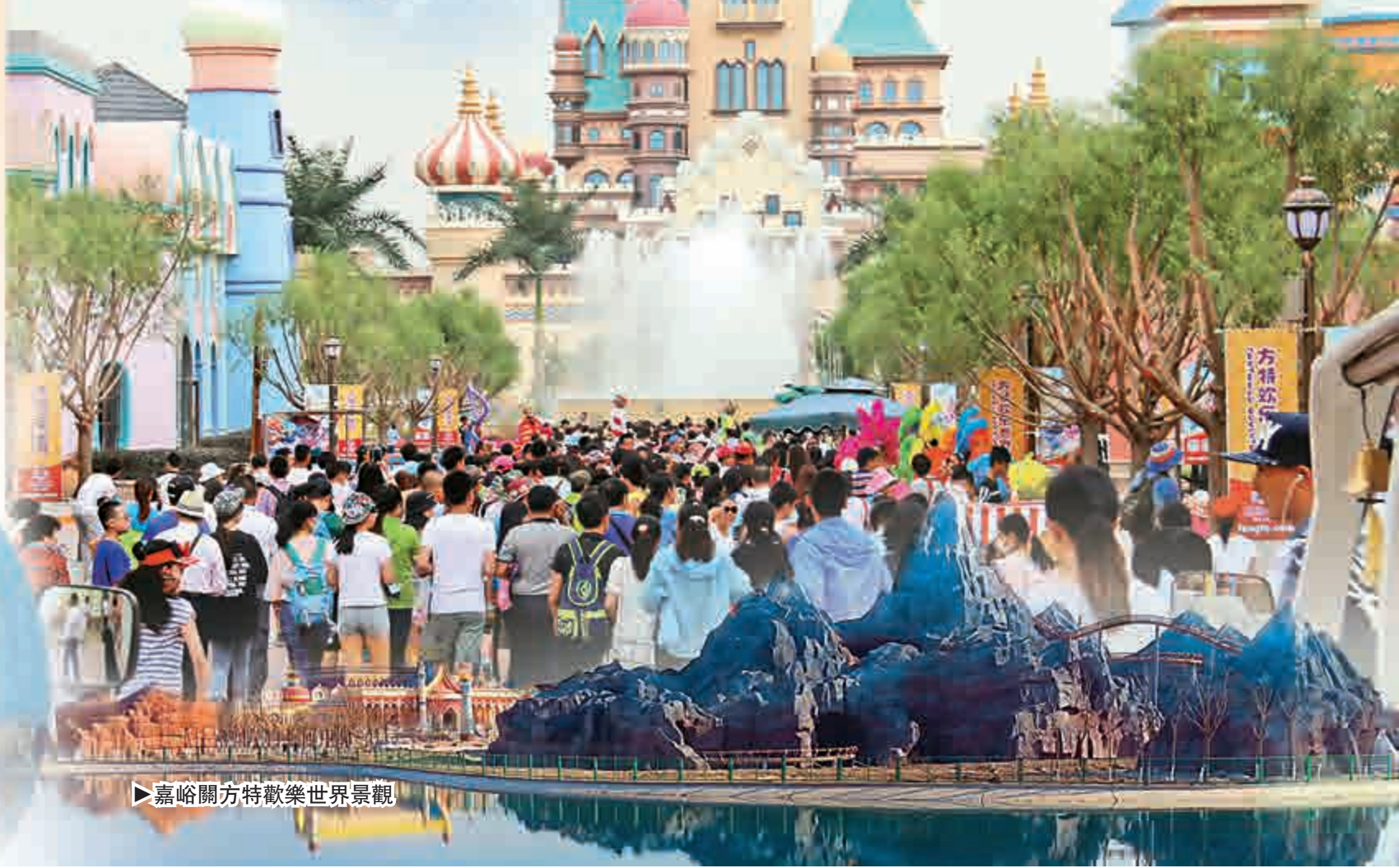
►嘉峪關方特歡樂世界景觀