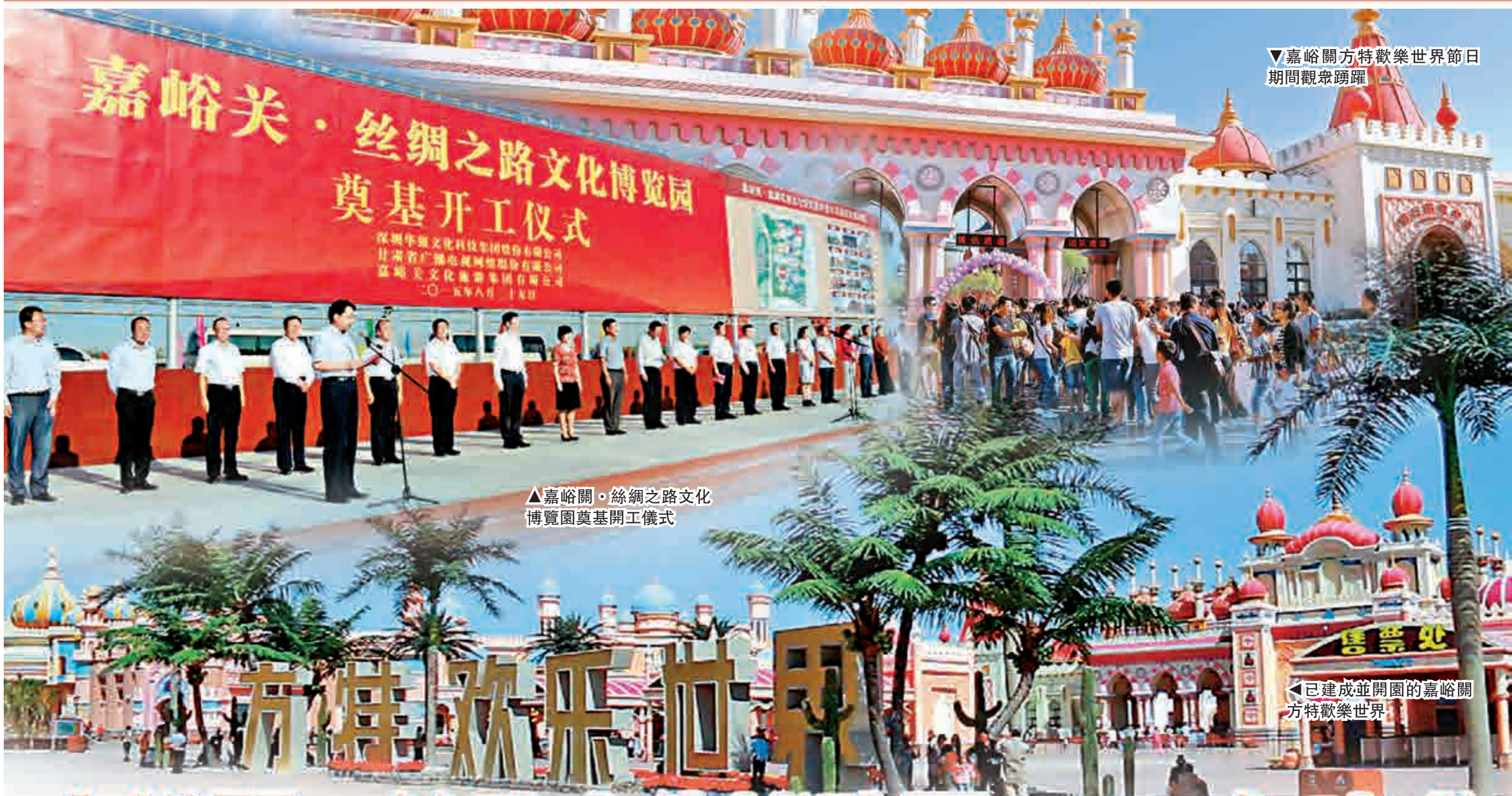
▼嘉峪關方特歡樂世界節日期間觀眾踴躍