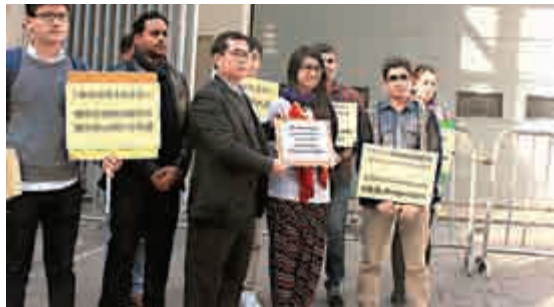
▲政府指本港少數族裔人士貧窮率為13.9%，比全港整體貧窮率15.2%為低

【大公報訊】記者梁康然報道：政府昨日發表《2014年香港少數族裔人士貧窮情況報告》，指本港少數族裔人士貧窮率為13.9%，比全港整體貧窮率15.2%為低，不過各族群經濟能力落差很大，當中以南亞裔人士貧窮率最高（22.6%），而且該族群人口有迅速增長趨勢。政府將會繼續以不同政策為少數族裔提供適切而有針對性的支援。