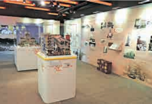
愛丁堡廣場展城館一個介紹中環的展覽

要認識香港城市演變，最好由中環這個政治和經濟中心入手。區內每幢大廈、每條街道的背後都有不同故事，融會一起後，就能了解香港的發展脈絡。展館最接近的「城市印象@中環」展覽，提供了探索中環的入門途徑。 該展覽由嘉道理家族贊助的香港社會發展回顧項目籌辦，我特別留意這家族和猶太人在中環的事跡。太子大廈的前身是太子行，由遮打和麼地合夥興建，一九二三年先售予猶太人約瑟，其後再由置地購入，一九六五年重建成太子大廈。 艾利·嘉道理十九世紀末入股香港大酒店，該酒店是達官貴人和國際旅客經常出入之地。從酒店扒房的餐牌可見，一九二零年的「銀扒」價錢由一元起，其時中上環碼頭的苦力每月僅賺四、五元。 在中巴取得港島巴士專營權之前，香港大酒店曾營運數條巴士線。可惜酒店北翼於一九二六年失火焚毀，風光不再。其後置地購入北翼，一九三二年建成告羅士打行。南翼營業至一九五二年由中建企業購入，六年後建成中建大廈。 早期中環商廈為置地壟斷，但旗下的建築群卻有一幢為嘉道理家族擁有，就是夾在今天遮打大廈和文華東方酒店之間的聖佐治大廈。該廈的前身聖佐治行由置地興建，一九二零年代售予新旗昌洋行和嘉道理家族，一九六五年拆卸重建。置地高層事後回想，無不慨嘆當年作出了這項售樓決定。