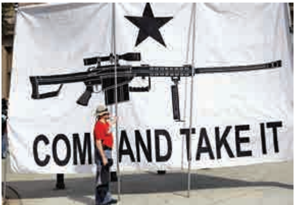
▲美國得州首府奧斯丁市一個用槍廣告

【大公報訊】綜合路透社、英國《衛報》報道：新年新氣象，很多新的規定和法律都會因應新年而生效，2016年也不例外。因此，從周五（1月1日）開始，愛沙尼亞讓同性婚姻合法，開前蘇聯國家先河；荷蘭的商店再也不能免費提供膠袋了，美國得州將允許民眾公開攜