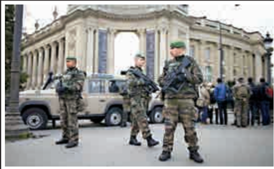
▲持槍的巴黎警察駐守在大皇宮前