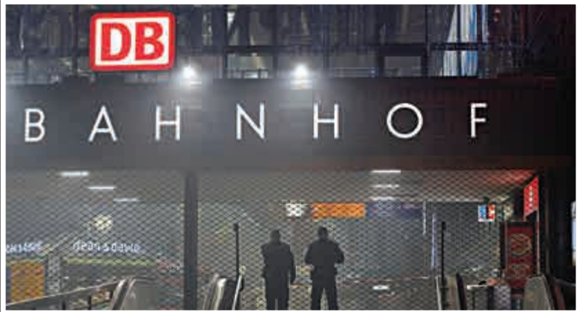
▲慕尼黑火車站接到恐襲威脅之後關閉