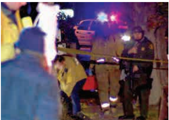
▲美國洛杉磯警方周四封鎖羅蘭崗槍擊案現場