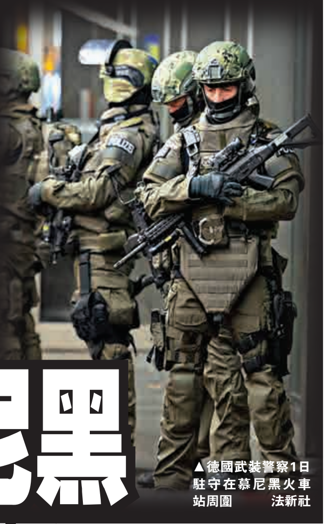
▲德國武裝警察1日駐守在慕尼黑火車站周圍