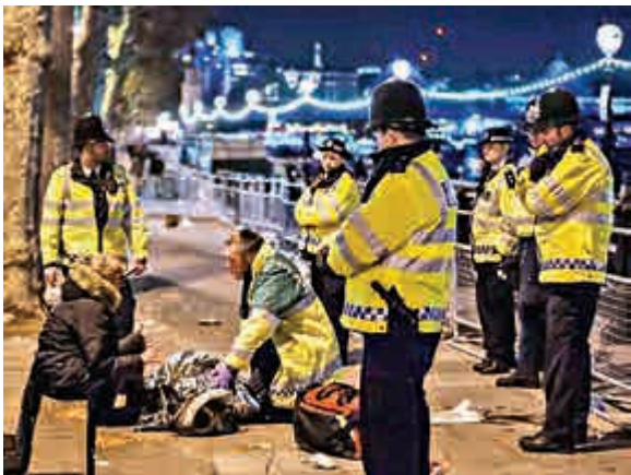
▲倫敦警察在協助一名倒地不醒的醉漢

印尼警方迄今共逮捕12名打算在新年假期發動恐怖攻擊的嫌犯。印警反恐特種部隊「日前在中爪哇、東爪哇和西爪哇一帶逮捕7名嫌犯。7名嫌犯中有兩人準備進行自殺式炸彈攻擊行動。此前，印尼警方在去年聖誕節假期逮捕兩名嫌犯，其中一名來自中國內地的維吾爾族人準備在印尼發動自殺式炸彈攻擊。」