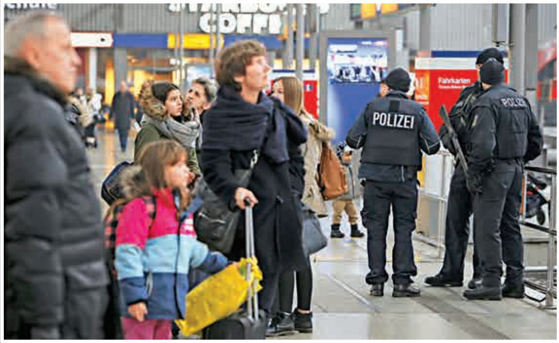
▲德國慕尼黑火車站1日重開，站內有持槍警員駐守

據悉，拉奇曼皈依伊斯蘭教並宣誓效忠ISIS項目巴格達迪，曾試圖離開美國前往敘利亞。據悉，拉奇曼計劃利用新年恐襲作為加入ISIS的「投名狀」。據稱，拉奇曼具有犯罪前科，曾在2006年被判搶劫罪入獄五年，曾因精神問題被捕。