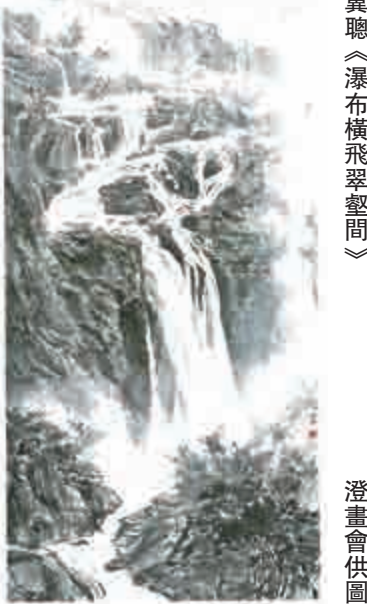
▲黃翼聰《瀑布橫飛翠壑間》