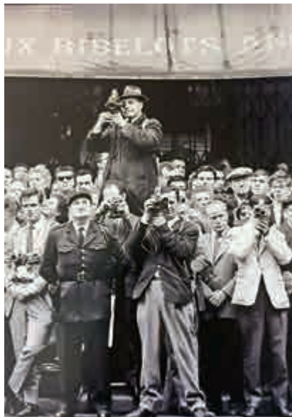
▲埃里希·萊辛作品《在巴黎峰會等待的記者》