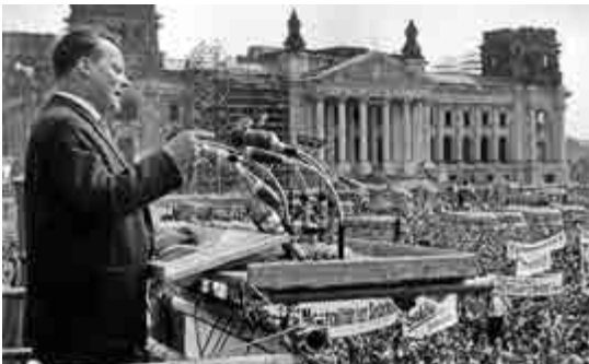
▲埃里希·萊辛一九五九年攝《柏林市長對柏林市民講話》