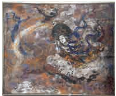
▲樂劍作品《夢裏飛天》

此外，樂劍還有二十多幅作品獲全國工筆山水畫展金獎、全國第四屆中國畫展優秀獎、第三屆全國線描藝術展優秀獎、江蘇美術文華獎等，並參加由中國美術館主辦的赴土耳其「水墨精神——當代中國畫作品展」等衆多大型展覽。