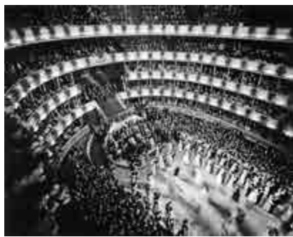
▲每年「Fasching」（狂歡節）的最後一周，維也納國家歌劇院都會舉辦著名的「維也納歌劇院舞會」。圖爲埃里希·萊辛一九六〇年作品《維也納歌劇院舞會》