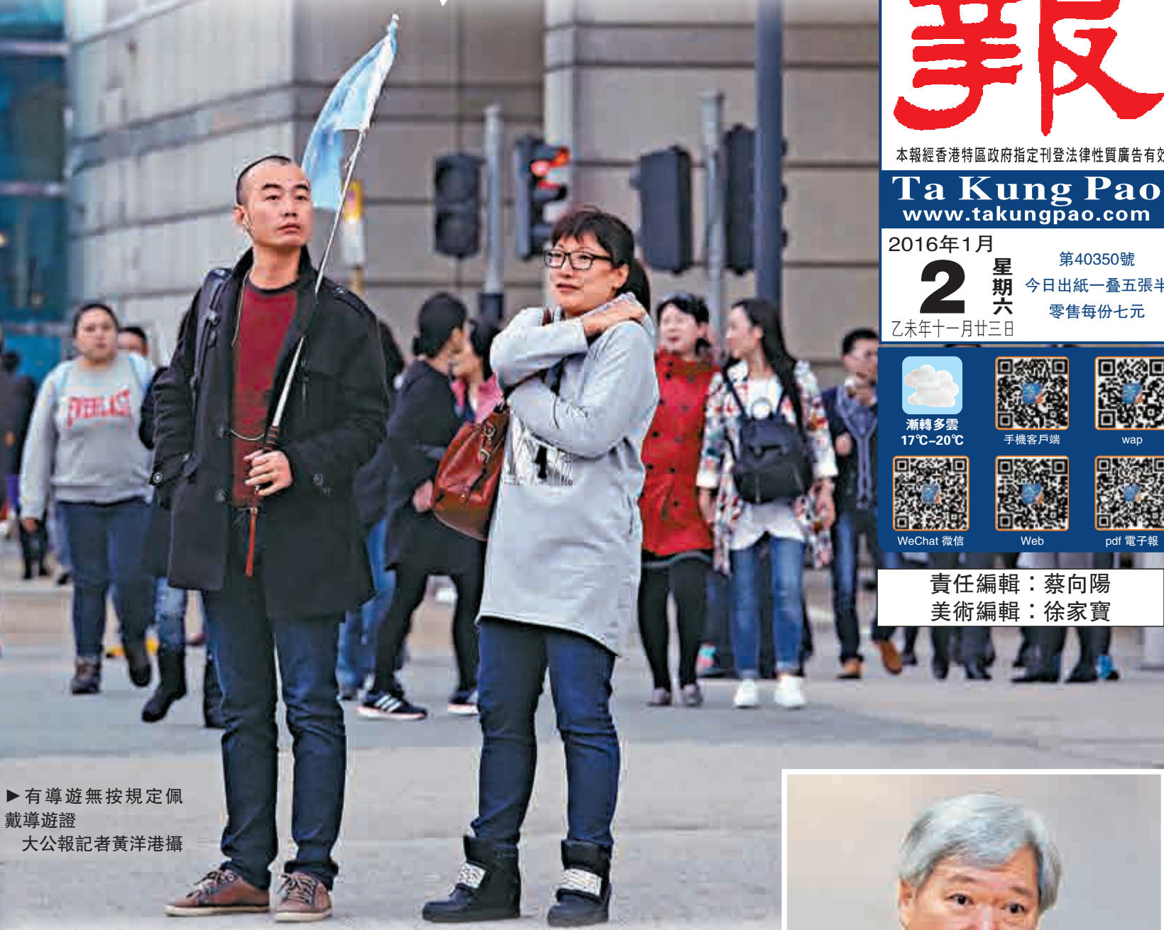
▶ 有導遊無按規定佩戴導遊證

旅議會理事莊樹煌則表示，對於旅議會前日（上月31日）召開記者會並不知情，質疑議會溝通有問題。