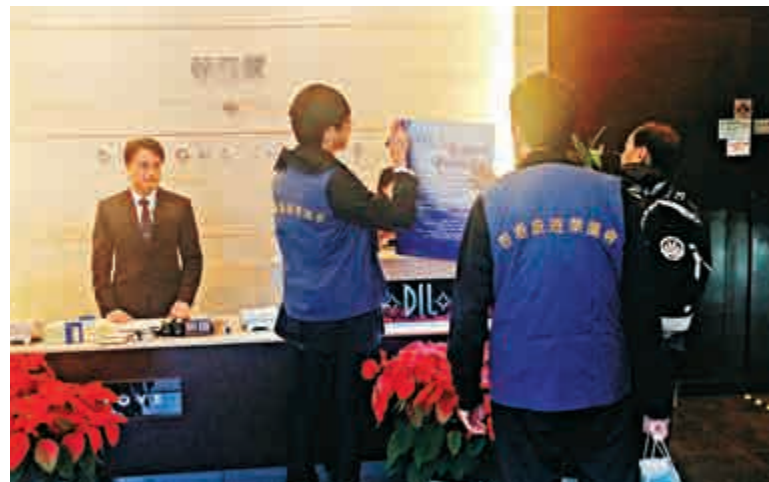
▲ 旅議會派員到多間已經退出指定購物登記名單店舖，收回印有百分百退款保障的海報

根據旅議會新措施規定，轄下會員旅行社接待的內地團只能到已登記的定點購物店、導遊需佩戴證件、旅遊巴士需貼上展示旅行社牌照號碼及旅行團團號的「車頭紙」。