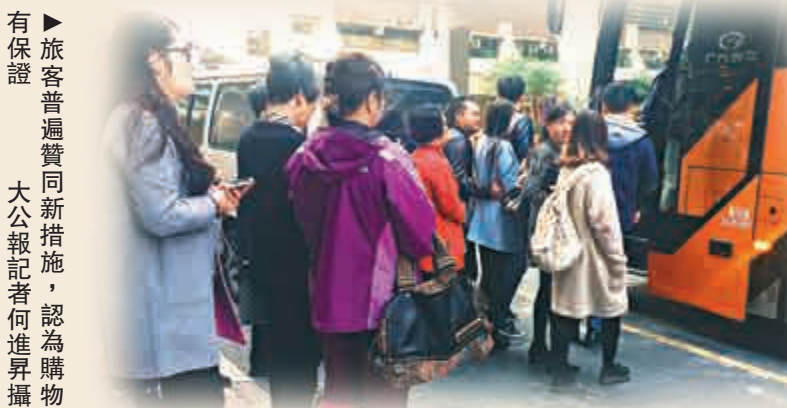
▶ 旅客普遍贊同新措施，認為購物有保障

有不願透露姓名的內地領隊稱，領隊及導遊須隨身掛上導遊證的做法「很麻煩」。亦有導遊說，議會在旅遊旺季加強巡查可能會延誤旅行團，對導遊造成壓力。