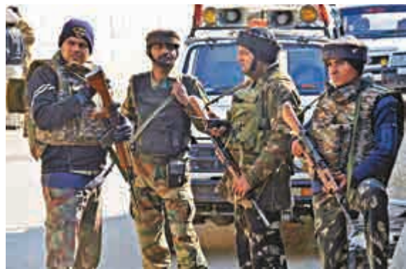
▲襲擊案發生後旁遮普邦全面進入戒備狀態

【大公報訊】據《印度時報》、路透社報道：印度鄰近巴基斯坦邊界的一座空軍基地2日凌晨三點半左右遭到身份不明的好戰分子攻擊，4名槍手與2名警衛在攻擊中喪生。事件發生後，基地所在的旁遮普邦全面進入