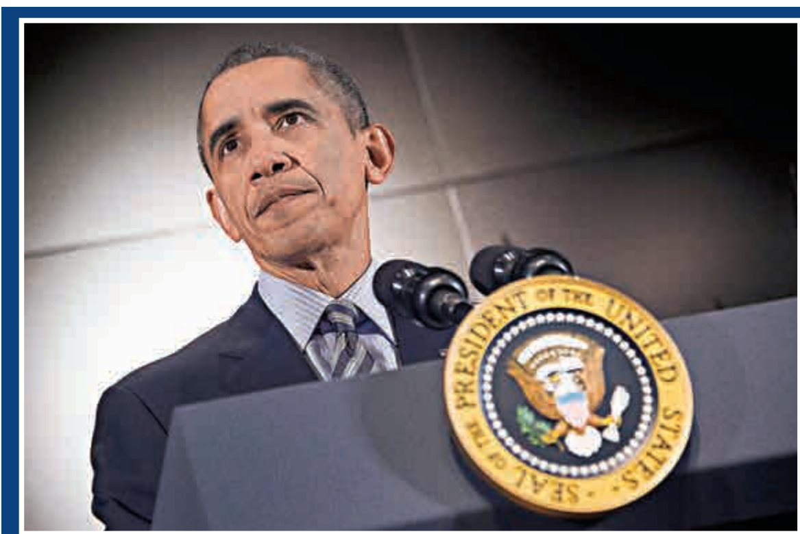
▲美國總統奧巴馬指將會繞過國會進行控槍