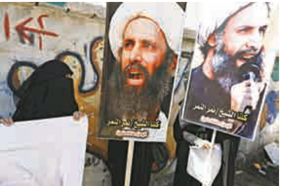
▲什葉派穆斯林今年10月掀起示威，反對沙特判尼姆有罪 資料圖片

自2015年1月《查理周刊》雜誌社巴黎總部遭襲以來，共有1萬名軍人參與法國本土安保行動「哨兵行動」。2015年11月13日，巴黎發生多起恐怖襲擊，造成至少130人死亡、約350人受傷。目前法國全境仍處於緊急狀態，持槍軍警進行巡邏，保護政府部門、軍警機關和宗教場所等敏感地點和公共場所安全。