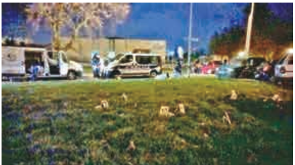
▲警方在事發後趕至清真寺門前