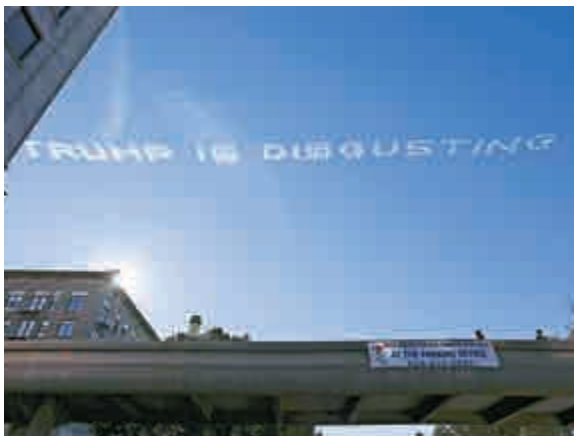
▲富商培特租用五架飛機於加州花車遊行期間在空中拉出「特朗普噁心」的字樣

美國聯邦調查局只公布「合法槍殺」的數據，也就是說在法律框架下擊斃的罪犯，根據該局的數字，在2014年，共有444人被警方擊斃。但聯邦調查局沒有公布其他數字，這也引起各方的批評。