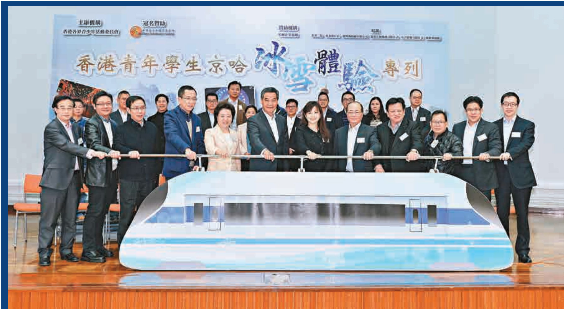
▲主禮嘉賓梁振英（前排左六）、仇鴻（前排左五）、吳克儉（前排右五）、陳林（前排左三）昨日主持啟動禮

是次香港各界青少年活動委員會籌委會成員包括：團長陳仲尼、常務副團長施榮忻、副團長霍啟剛、盧金榮及秘書長黃進達等，他們希望通過此次活動加深香港青年對國家發展的認識，增強香港青年凝聚力及影響力。