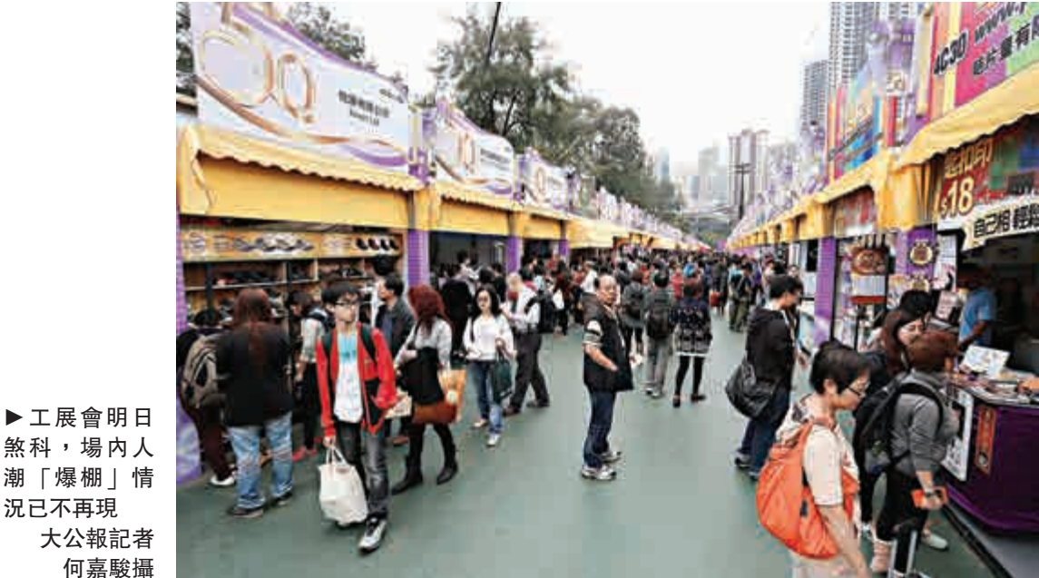
►工展會明日煞科，場內人潮「爆棚」情況已不再現

林國昌續指，政府曾發信表明，有關丁權轉讓協議是透過放入地契條款的形式禁止，一旦違反，最多只可收回相關土地。他又指，政府給予原居民丁權，背後理念雖然是「自住」，但「自住」並非先決條件，原居民有自由將物業處置、變賣，而男丁賣「丁權」牟利，將「丁權」變錢無可厚非，與一般市民賣樓賺錢無異。他認為，「套丁」僅涉及鄉界內土地，不影響整體土地供應。案件平息後，政府應與鄉議局研究尋求一條出路，完善現有丁權制度，「如何方便人們建屋，而有（丁）權但無地的人，如何尋求一個合作空間，又不會觸犯法律」。