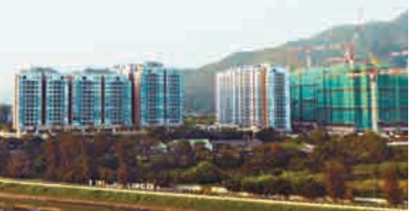
▲元朗峻巒長假賣約10伙，已是銷情較理想的樓盤

不過，黃德凡表示，雖然一眾藍籌股估值偏低，然而有關股份大多欠缺高增長的動力，當中可能只得騰訊（00700）及保險股有較高的增長，加上部分央企的主管可能會涉及訴訟，如最近中國電信（00728）前董事