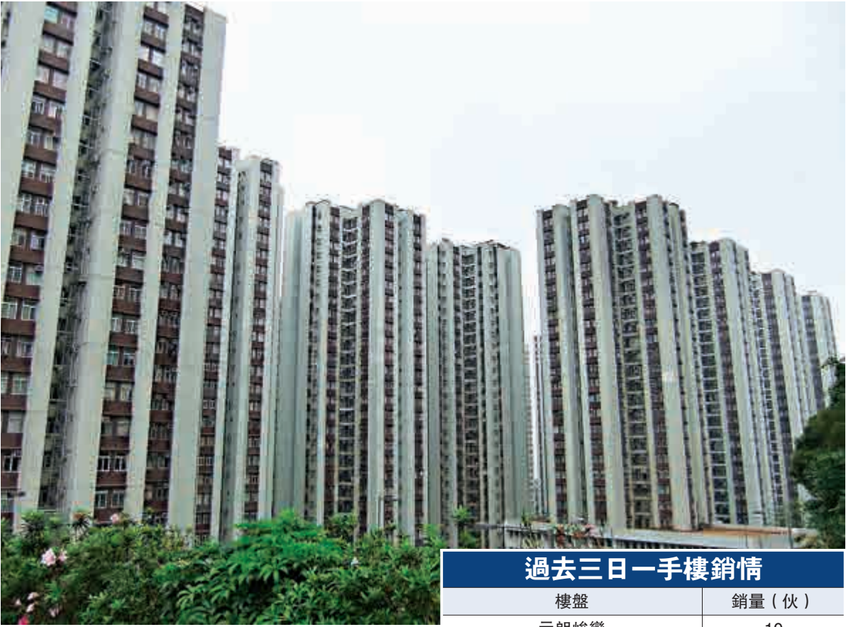
▲太古城本月平均實用呎價1.35萬元，倒退至2014年6月份水平

樓市現轉勢訊號，豪宅業主趁新一年爭相掙貨。消息指，九龍站二手業主陸續失去耐性，計劃劈價止