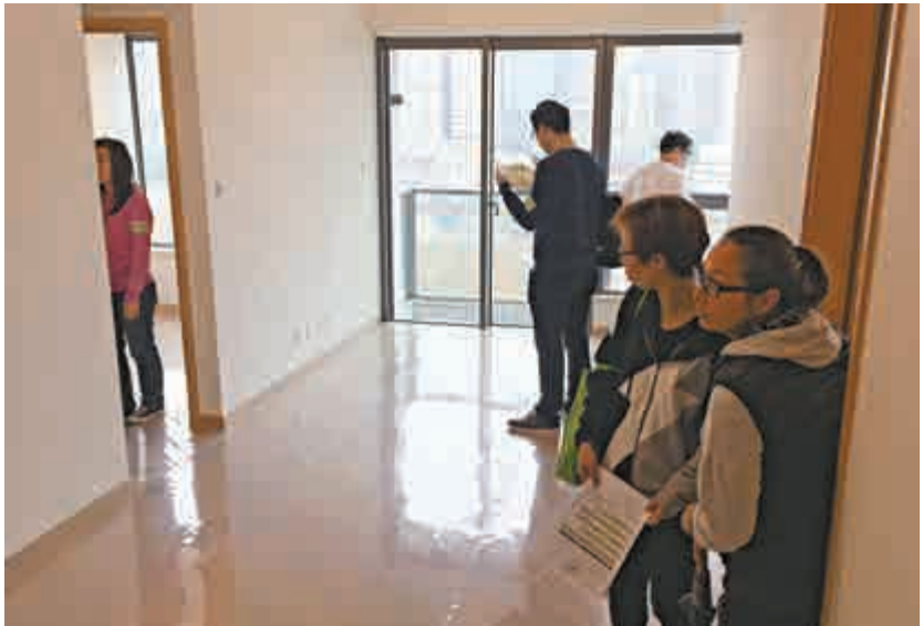
▲市民到「煥然壹居」現樓參觀