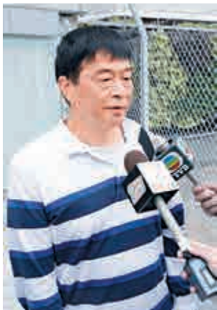
▲陶先生表示，如果抽中籤，會替兒子繳付約50萬至60萬元首期，其後由兒子續供

本身在油塘紀律部隊宿舍居住的黃先生，與太太參觀現樓，他們育有兩名就讀幼稚園的子女，認為啓德區環境不錯，值得考慮購買，但擔心香港跟隨美國加息，令樓價下跌，故他仍然採取審慎的態度。