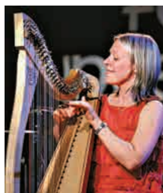
▲英國豎琴家葛南·吉芭德

《魔登奇緣》魔幻豎琴音樂欣賞會由Grandview Culture聯同誠品舉辦，一月二十二日晚上七時三十分在誠品銅鑼灣店舉行，一月二