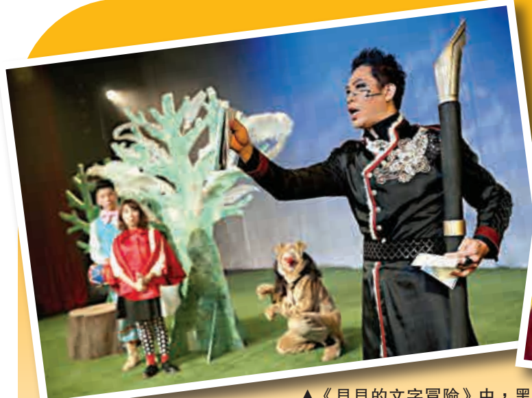
▲《貝貝的文字冒險》中，黑騎士要求貝貝以文字抒發感受