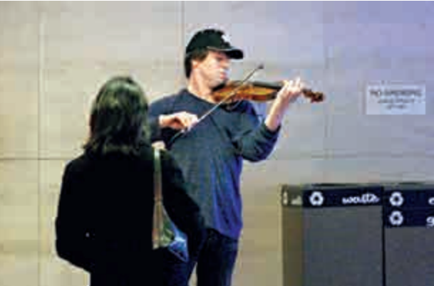
▼Joshua bell 地鐵站演奏，駐足聆聽者幾稀