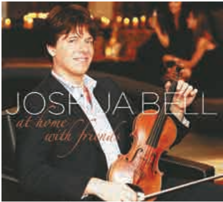
▼Joshua bell 是當代知名小提琴手

一個音樂演奏者在華盛頓D.C.地鐵站L'Enfer廣場的入口演奏了四十五分鐘。這四十五分鐘，成千上萬的乘客經過這裏，只有七個人真正停下來聽他演奏，有些人停幾秒鐘，看看表，即匆匆走了，有的扔下一美元，沒有停步，有的靠着牆根聽他演奏，看看表，走了。當他演奏完畢，沒有人鼓掌，喝彩，更沒有人知道他就是Joshua Bell，當今世界上最有名的小提琴手之一。他一共賺了三十二美元……就在他在地鐵站演奏的前兩天，他在波士頓的歌劇院裏表演，門票上百美元，卻座無虛席一票難求！ 情況確實令人很感慨。我想，有些人進音樂廳原是衝那華麗的建築和高昂的門票去的，而Joshua Bell選擇的位置實在不是欣賞音樂的地方，人們奔走不暇，唯恐耽誤了趕路，即使有一對很好音樂的耳朵，也被非音樂的雙腿給拖累了。欣賞藝術總得有閑才行。 不過這種情形在我們中國一定不會發生，這主要倒不在耳朵水平之高低，而是像Joshua Bell這樣的大師，一定早已被宣傳傳家喻戶曉，記者和狗仔隊早已把他的照片和錄像在小報和屏幕上到處刊登；他站在地鐵站廣場的入口演奏必將引起擁堵以至騷亂，警察一定趕來干預——單是粉絲（無論什麼東西時髦他們就馬上撲上去）就成千上萬，「只有七個人真正停下來聽他演奏」那種冷冷清清，是絕對不會出現的。 這樣的心思浩茫是我讀書時的壞習慣之一，卻馬上就覺得很對不起作者，趕緊懸崖勒馬，回過頭來弄清楚這海外奇談同作者要談的主旨有什麼關係，只見作者繼續寫道： 「整個人類世界，與地鐵站口有什麼兩樣呢？有許多類似Joshua Bell的人與我們失之交臂，如果他們被人們發現，看出他們身上發出光亮的東西，給他們以尊重、關注、喝彩，那美麗的星空該是怎樣一種絢麗多彩的狀況呢？」（第十一頁） 作者想得很高遠了，而且滿懷高雅的善意。我們的世界是應該更加絢麗多彩一點，把精神搞得那麼緊張幹什麼！ 另一則。 書中《看戲的不是傻子》一文批評時下流行的假唱，其「頭一尾道」：「假唱是個新鮮把戲，「唱」者不用出聲而是事先把自己唱的東西錄下來，然後在演唱的時候，讓人聽光盤發出的聲音，「唱」者只要對上口型……」 「科技的進步，使一些人的造假手段愈來愈高明，這叫與一利必生一弊……我們要歌唱家做什麼呢？我們在藝術上還追求什麼呢？」（第一百五十九頁） 但是聽名演員假唱還是有意義的，一則可以了解他們對口型的技術，