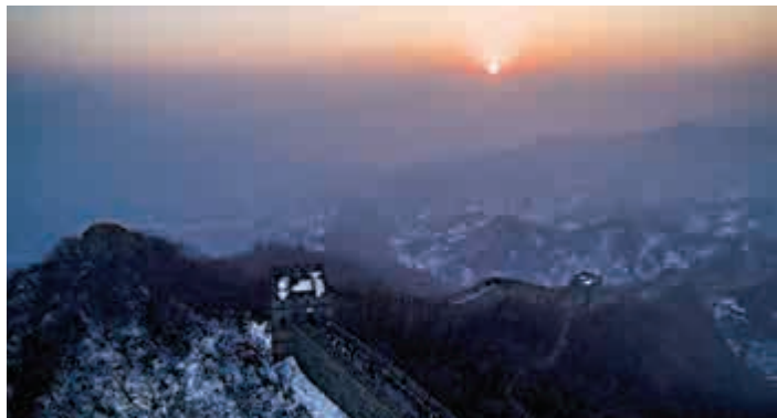
▲晨光照長城

很多成功人士到步入中年，時間相對寬鬆，才發現孩子長大了，錯過了影響孩子的黃金時期，孩子不再聽取父母教導，不再受父母左右，染上各種壞毛病，也不具備能力、情商和品格去接班自己辛苦打拚建立的事業。到那時，父母能做的已經比較有限，要重新扭轉孩子的價值觀、人際關係、加強能力也比較困難。而決定一個人是否成功的很多能力，都是需要家庭長期潛移默化的影響，而不是學校裏很容易教或可以考出來的能力，如早期的智力發展、自制力、對於學習的熱愛和持續學習的能力、與人相處和團隊合作的能力、健康的價值觀和好的品格等等。 所以我們應該注重在社會重塑健康的家庭價值觀，傳輸物質需求不是第一，愛和陪伴、家庭和睦方為最重要的家庭教育。我們應該努力營造一個充滿愛的家庭氛圍，花時間去陪伴他們，通過自己的言傳身教去影響孩子，讓孩子在這樣的氛圍下成長，才能讓他們真正贏在起跑線上！