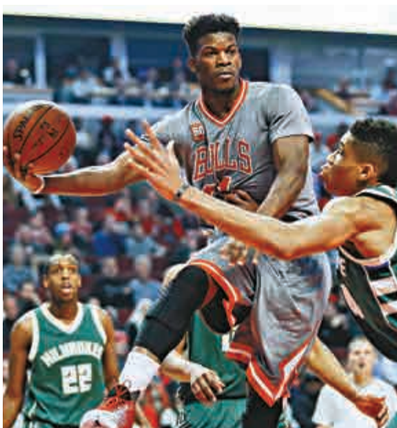
▲公牛球員占美畢拿（左）狀態大勇，繼續有出色表現