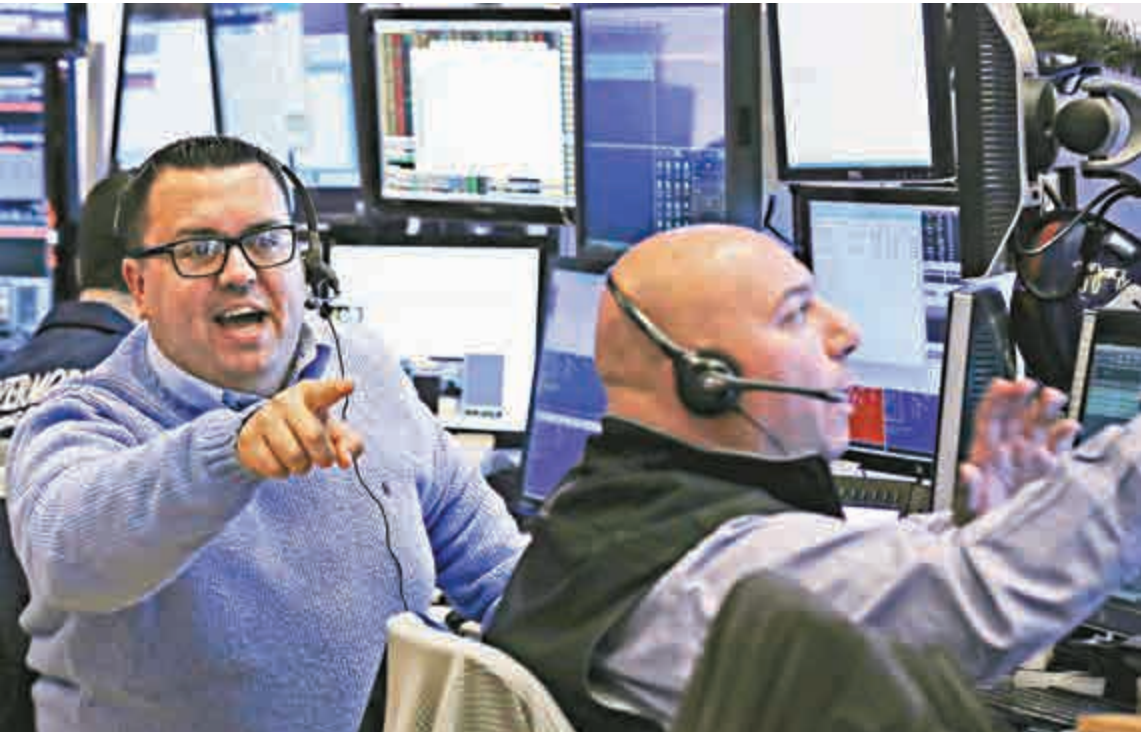
▲朝鮮局勢緊張，加上市場憂慮中國經濟增長放緩，美股早段大跌

然而，美元下跌並未刺激油價進一步上升，倫敦布蘭特原油期貨昨日反而再度跌至11年新低，最低見每桶35.33美元，跌近3%。原因是彭博社預測，美國上周原油庫存或會增加50萬桶，令全球原油供應過剩的問題持續下去。紐約期油亦曾跌至低位，最低見35.17美元，下跌1.2%。