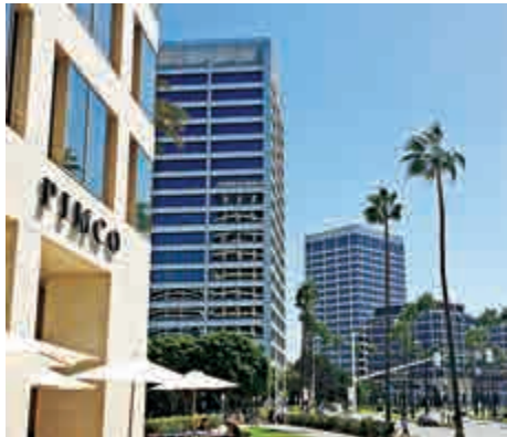
▲總回報基金近數月表現好轉，資金外流情況開始放慢