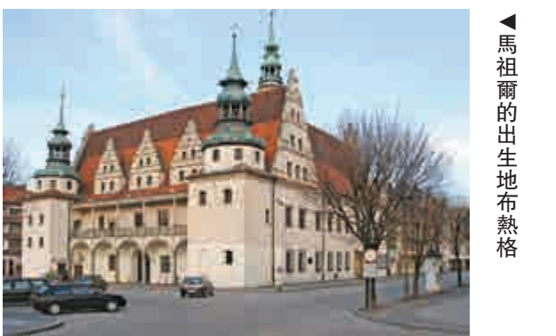
◀馬祖爾的出生地布熱格

從一九八九年聖尼古拉教堂那場音樂會起，到「九一一」紀念音樂會，再到英法兩國樂團合奏的逍遙音樂節演出，馬祖爾的一生一直在試圖證明音樂之於生活的意義。在他看來，音樂並不是茶餘飯後的消遣，也不是少數人陽春白雪的雅好，而是介入乃至改變社會的重要力量。我們不要忘了，格萬豪斯樂團的主場聖尼古拉教堂曾是巴赫《聖約翰受難曲》的首演地。曲中有一句「你的形象安慰我，悲哀中給我力量」，本意讚美天主，若將劇中的「你」替換為世上那些偉大而精妙的旋律，也並無不妥吧。