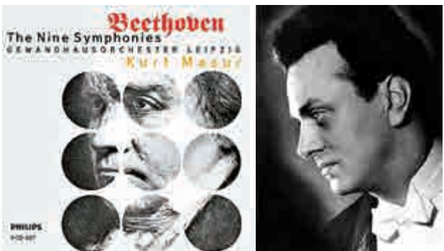
▲馬祖爾與格萬豪斯樂團灌錄的貝多芬交響曲全集