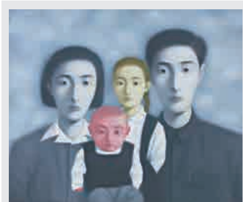
▲油彩布本《血緣——大家庭17號1998年》，張曉剛一九九八年作