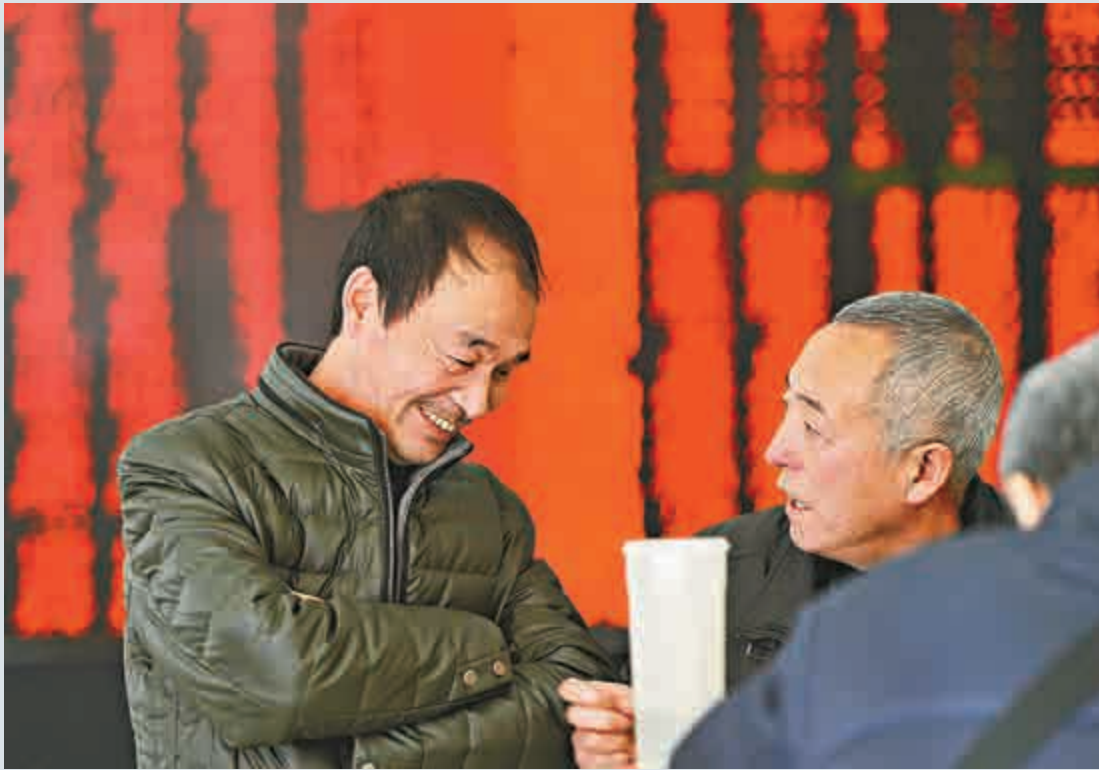
▲昨日山西太原一證券營業部的股民談論翻紅大漲的股指時面露喜色。當日滬深兩市高開高走

截至昨日收盤，滬綜指報3361.84點，漲2.25%；深成指報11724.88點，漲2.24%；創業板指報2468.37點，漲2.41%；滬深300指報3539.81點，上漲61.03點，漲1.75%。滬深兩市全天共成交6995億元（人民幣，下同），較上一交易日的8115億元縮量逾一成。 東北證券分析師沈正陽表示，開年首日大跌跟基本面不佳、大部分行業業績趨勢性下降有關。在供求關係預期發生變化之際，上攻乏力，市場以退爲進往是大概率選擇。暴跌是風險快速釋放的過程，是對供求關係趨弱的反應、也是對元旦前最後一周反歷史經驗的防禦之策。熔斷機制的表現、某種意義上加速了市場的波動。 沈正陽續稱，客觀而言，熔斷機制並非市場下跌的主因、熔斷機制對市場的影響力要遠小於限售股解禁、遠小於新股發行制度的改革等，熔斷機制帶來的市場衝擊、持續性不會太強。