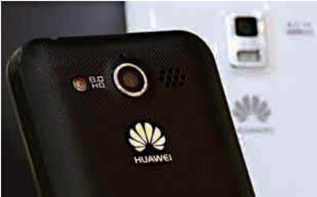
▲華為昨日數據顯示，公司去年每秒鐘售出三部智能手機

【大公報訊】在線旅遊行業加速整合。衆信旅遊（002707）昨日公告稱，擬通過「增資+股權轉讓」的方式投資窮遊網。預計公司出資規模達2500萬美元（約合人民幣1.62億元）。交易完成後，衆信旅遊將間接持有窮遊網5.499%的股權。 公告顯示，本次出資方包括衆信旅遊全資子公司香港衆信、SIG以及優投金鼎，交易總額為5700萬美元，取得窮遊網12.54%股權。值得一提的是，阿里巴巴集團在窮遊網中的持股比例將由28.09%降至24.716%，但仍為第二大股東。 衆信旅遊方面表示，投資窮遊網能夠增強公司定製遊及自由行板塊產品豐富度，增強公司線上業務體驗。同時借助窮遊網龐大的用戶基礎提升產品和服務質量，助力公司搭建完整的業務體系。內地知名經濟學家宋清輝指出，衆信旅遊對窮遊網的投資可以說是拉開了今年旅遊業併購大幕。他並預計，行業投資併購等行爲，會集中體現在資源端和供應鏈的整合上，並向產業鏈上游重點布局。 資料顯示，窮遊網於2004年誕生於德國漢堡的一個留學生宿舍，現有用戶超過6000萬人。公司爲旅行者提供指南攻略、遊記等實用旅行信息以及行程助手等工具，通過大數據幫助旅行者做出更加聰明的個性化旅行決策。財務數據方面，截至2014年12月31日，窮遊網淨資產為142.46萬元（人民幣，下同）。2015年前九個月，公司實現營收1898.02萬元，錄得淨利潤41.78萬元。 事實上，衆信旅遊近年來不斷整合業內資源。公司2014年以6.3億元拿下竹園國際旅行社有限公司70%股權，隨後又以提供不超過6000萬元貸款爲條件收購游哉網15%股份。2015年7月份，衆信旅遊以佔股54%的方式戰略投資「行天下」，同年11月，公司宣布與美國天益遊旅遊集團正式達成戰略合作。 衆信旅遊於去年11月13日起停牌，停牌前報52.62元。