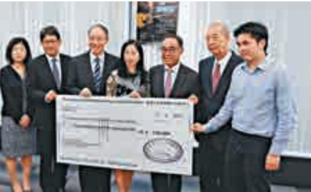
▲香港日本文化協會為每年有志留學的香港人，提供10個獎學金名額

隨着近年經濟放緩，該教育基金只剩下500萬日圓，為讓更多港人赴日留學，基金決定擴大獎學金名額，提升至每年有10人獲頒獎學金，每人將獲50萬日圓留日獎學金。柳生政一解釋，獎學金不設任何申請條件和限制，亦不一定要赴日本讀大學，申請人可為興趣赴日學習茶道、攝影、柔道、設計、語言等，唯一要求是申請人