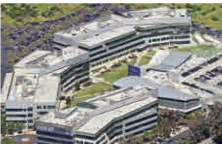
▲加州雅虎園區

另一種方式是，私募股權公司併購雅虎的核心網絡事業，同時也將雅虎的媒體和新聞事業與《每日郵報》的網上事業合併。合併的單位將組成一家新公司，由《每日郵報》經營，並且給予每日郵報母公司較第一種方式更大的股權。