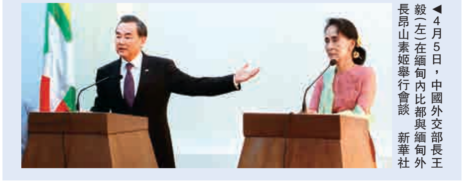
▲4月5日，中國外交部長王毅（左）在緬甸內比都與緬甸外長昂山素姬舉行會談

緬甸在舊軍事政權時代遭到國際社會孤立，中國對其提供支持，兩國建立了胞波情誼。2011年緬甸建立民選政府以來，與歐美的關係迅速改善，中國的影響力削弱。中國與越菲在南海問題上的對立也促使中國不能在緬甸問題上放任其倒向美日。