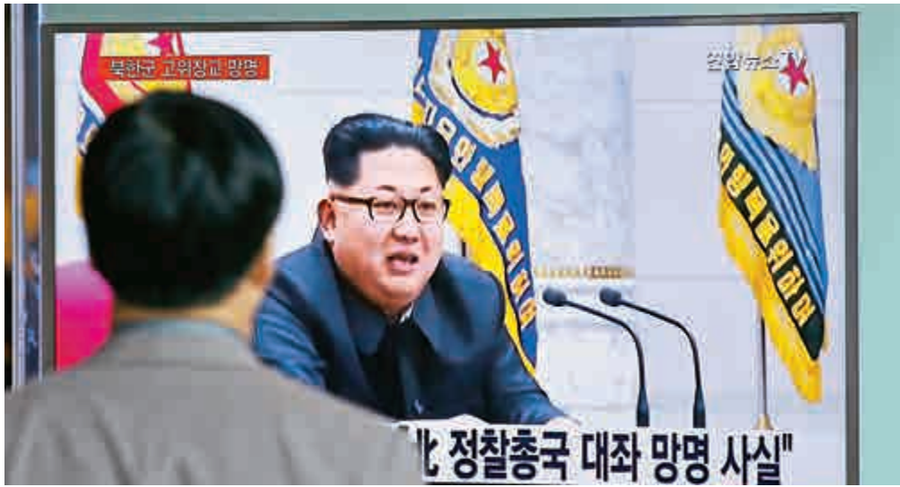
▲首爾一名男子在看電視新聞裏的朝鮮最高領導人金正恩的畫面

中國外交部發言人陸慷11日表示，朝鮮駐外餐廳13名服務員係合法從中國出境。陸慷表示，關於一些朝鮮在華公民失蹤的報道，經過調查，13名朝鮮籍人員於4月6日凌晨持有效護照正常出境。需要特別強調的是，這些人持有的是有效身份證件，合法出入中國國境，不是非法入境朝鮮人。陸慷表示，關於非法入境朝鮮人問題，我們一貫按國際法、國內法及人道主義原則妥善處理，這是我們的既定政策。