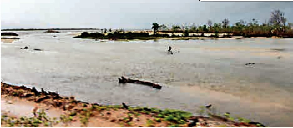
▲中國在緬甸土瓦經濟特區附近建設首個大型煉油廠的選址

儘管該項目遇到了資金問題。在2015年的第七屆湄公河—日本峰會上，東京還承諾提供大約67億美元用於對湄公河地區的經濟援助。土瓦經濟特區位於曼谷以西300公里，它將與大湄公河次區域南部經濟走廊連接起來。豐富的低工資勞動力使其成為日本企業理想的生產基地。