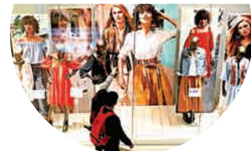
▲顧客在福州商場購物 資料圖片

李慧勇強調未來3至6個月中國經濟將處向上「脈衝期」，年內物價料呈溫和升勢，鑒於大量剩餘產能存在，中國出現惡性通脹的概率不大。劉學智相信，受豬肉價格、貨幣流動性，及CPI翹尾因素等影響，本季CPI同比料溫和上行。