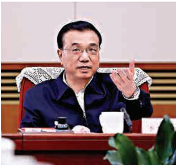
▲國務院總理李克強11日主持召開部分省（市）政府主要負責人經濟形勢座談會