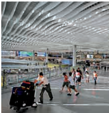
▲配合「三跑」，機場二號客運大樓將斥資165億元改建