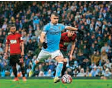
▲曼城射手阿古路 資料圖片

聯球員說：「（踢曼聯時）我在一場比賽中踢一個位置，但下一場卻踢另一個位置，他們根本不會讓我好好安頓下來，我亦因此難以立足。」迪馬利亞隨後大讚聖日耳門主帥巴蘭斯有清楚指引，自己踢得開心，表現自然好。 曼城預計陣容（4-5-1）： 門將 ：1赫特； 守衛 ：3沙格拿、30奧達文迪、20文加拉、22基捷基治； 中場 ：17奇雲迪布尼、25費蘭甸奴、6費蘭度、42耶耶托尼、21大衛施華； 前鋒 ：10阿古路。 聖日耳門陣容（4-3-3）： 門將 ：16奇雲查普； 守衛 ：19奧里亞、2堤亞高施華、5馬昆奴斯哥利亞、17麥士維； 中場 ：25拉比奧特、8莫達、6馬高華拉堤； 前鋒 ：9卡雲尼、10伊巴謙莫域、11迪馬利亞。