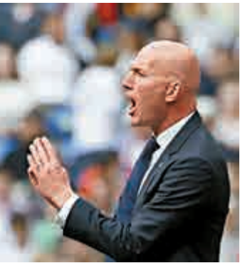
◀在西甲重燃爭標希望後，施丹也希望領皇馬晉級歐聯四強 資料圖片

皇馬主帥施丹當時亦有份比賽，皇馬最終亦拿下錦標，施丹更於決賽對利華古遜時射入一記經典「窩利」。