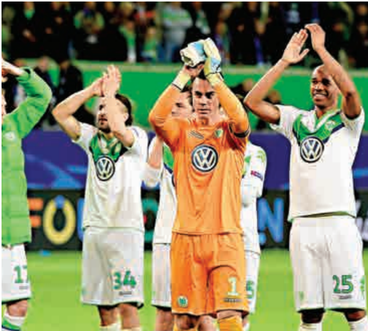
▲禾堡有兩球優勢在手，但並非絕對優勢 資料圖片 ◀C朗拿度是時候展示入球本領 資料圖片