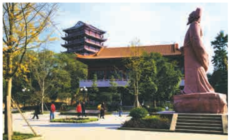
▲國家3A級景區杜甫草堂詩聖廣場