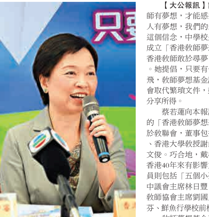
▲蔡若蓮期待，教師夢想基金帶動教學夢飛翔

最受歡迎院校：中山大學、暨南大學、廣州中醫藥學院 最受歡迎專業：經濟管理金融貿易（24.3%）、醫藥（包括中醫）（15.5%）、語言（8%） 公布取錄結果：七月下旬