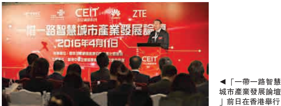
◀「一帶一路智慧城市產業發展論壇」前日在香港舉行

【大公報訊】記者龔學鳴報道：由國家互聯網信息辦公室信息化發展局指導、香港中國企業協會資訊科技行業委員會主辦的「一帶一路智慧城市產業發展論壇」前日在香港萬麗海景酒店舉行，該論壇積極支持香港智慧城市發展，並研討如何利用香港區位優勢參與智慧城市建設。 智慧城市是以互聯網、物聯網、電信網、無線寬帶網等網絡組合為基礎，以智能技術高度集成、智慧產業高端發展、智慧服務高效便民為主要特徵的城市發展新模式。此外，各國都紛紛提出智慧城市的發展戰略，希望借助新的平台尋求更多發展機遇。 這次論壇圍繞「智慧城市」這一主題，深入探討其對民生、環保、公共安全、城市服務、商業活動等多方面的影響，致力於促進香港智慧城市產業的發展。出席