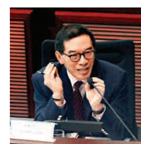
▲證監會主席唐家成曾表示，有留意到創業板上大落的情況，並指會和港交所檢討整體上市政策

由於自去年11月底起，證監會主席唐家成表示，有留意到創業板上大落的情況，並表示在和港交所（00388）檢討整體