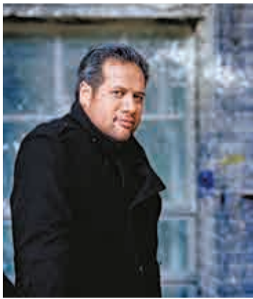
▲男低中音利馬露演出經驗豐富

《伯沙撒王的盛宴》將於四月二十九和三十日晚上八時於香港文化中心音樂廳舉行，而兩場音樂會均設免費音樂會前講座。《伯沙撒王的盛宴》門票現於城市售票網發售，查詢節目詳情可致電二七二一二三三或瀏覽www.hkphil.org。