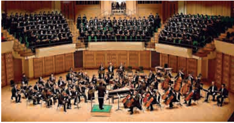
▲港樂和香港管弦樂團合唱團將合作演出

今次演出由劉易斯當指揮，他是現任傑克遜威爾交響樂團音樂總監及紐約愛樂助理指揮，曾與多個樂團合作。