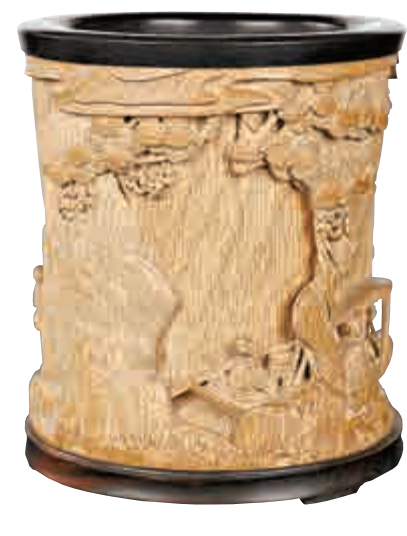
▲浮雕「伯牙撫琴」筆筒（當代）