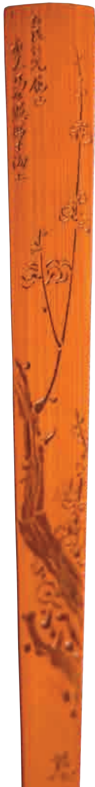
►竹根圓雕「旁觀者」（當代） ▲民國著名竹刻藝術大師支慈庵的竹刻 扇骨「梅花圖」