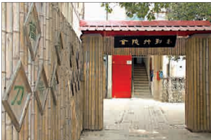
▲金陵竹刻藝術博物館位於南京市玄武區富貴山四號

金陵竹刻藝術博物館成立於二〇〇九年十一月，是經江蘇省文物局批准、省民政廳註冊登記的一家民營博物館。其宗旨為立志民族文化傳承的國家意識，全力保護和傳承金陵竹刻藝術。