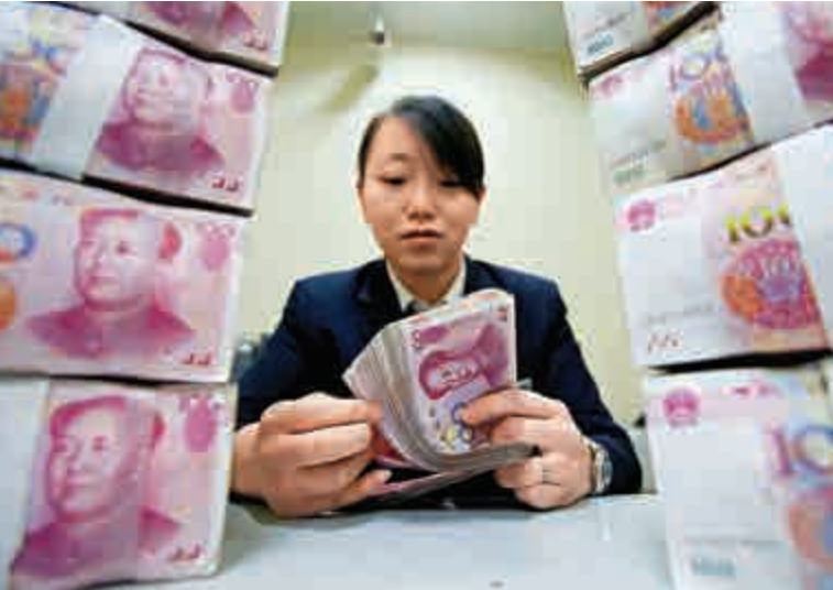
◀據路透不完全统计，截至昨日，月內銀行間債市取消或推遲發行的短融、中票等已有29隻，涉資288億 資料圖片

據路透不完全統計，截至昨日，月內銀行間債市取消或推遲發行的短融、中票等已有29隻，原因多為「市場波動較大」、「認購不足」，涉及規模288.3億元。中