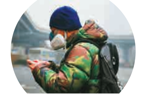
▲去年12月8日，行人戴著口罩行走在霧霾籠罩的北京街頭 資料圖片