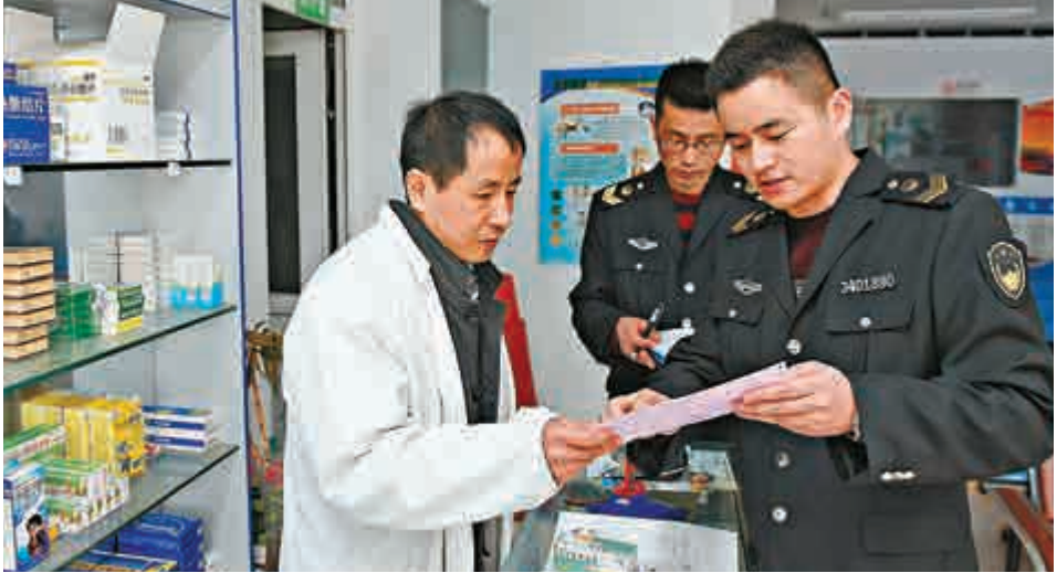
▲3月23日，合肥市工作人員對一家私人診所的藥品和進貨單進行排查

將建疫苗動態調整機制 國家衛生計生委、食品藥品監管總局新聞發言人13日對記者表示，兩部委正在會同相關部門，按照國務院關於修訂《疫苗流通和預防接種管理條例》的決定，研究建立進