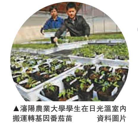
▲瀋陽農業大學學生在日光溫室內搬運轉基因番茄苗 資料圖片

品種即使取得安全證書，要進行商業化種植還需要滿足三個條件：一是進口安全證書的品種還需獲得生產應用安全證書；二是主要農作物還需按種子法的規定通過品種審定；三是種子生產經營者還需要經過知識產權權利人的同意才能生產經營。 「基於中國現有轉基因大豆、玉米、水稻研發狀況以及產業需求，我們目前還沒有批准商業化種植。」廖西元說。 中國工程院院士吳孔明介紹，到目前為止，中國批准投入商業化種植的轉基因作物只有兩種，一是轉基因抗蟲棉花，二是轉基因抗病毒番木瓜。