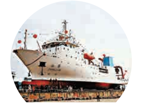
▲將在上交會上展示相關技術的載人深潛器母船「張騫號」