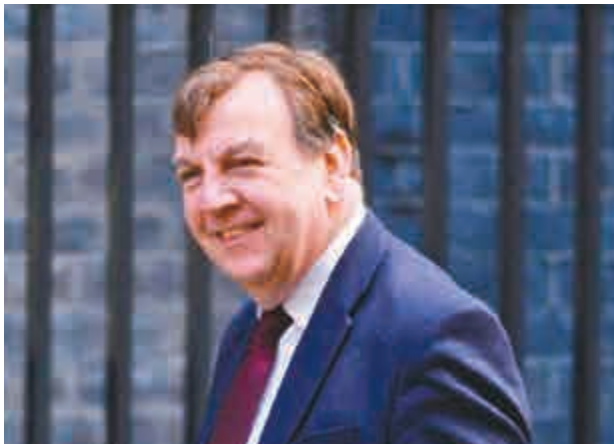
◀英國文化大臣韋廷毅

這個故事一直沒有出現在傳媒而引起了質疑，一個負責媒體監管的人與報紙廣播不報道這一事件的動機之間可能存在利益衝突。但報業人士則認爲不報道這一消息，是因為它與公共利益無關。