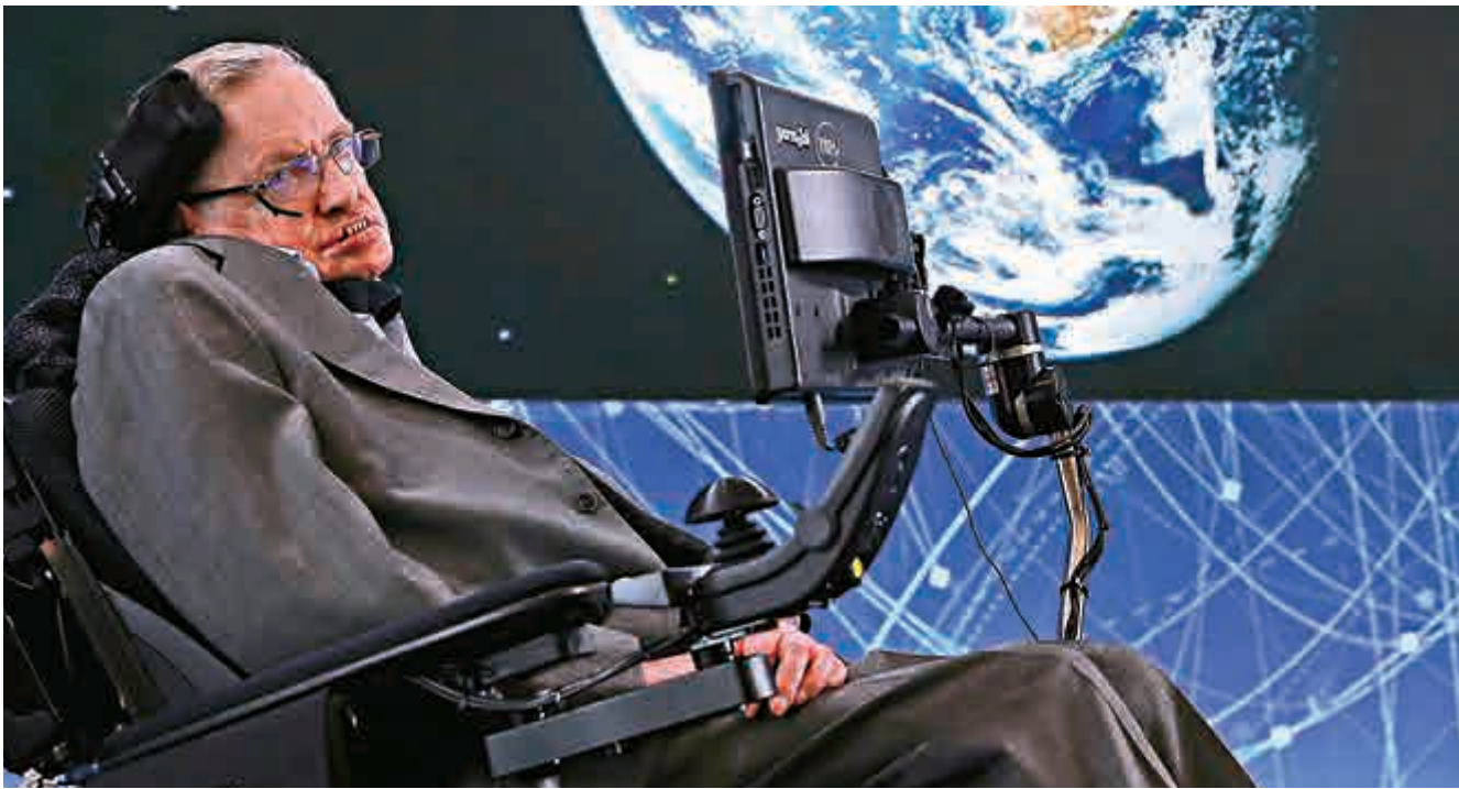
▲英國物理學家霍金出席12日的發布會