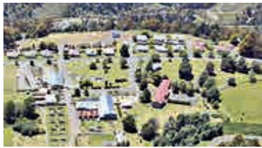
▲塔勒利亞鎮上的房屋