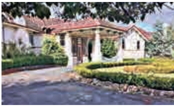
▲澳洲小鎮塔勒利亞

跟奧巴馬同屬民主黨的總統參選人希拉里，被認為有機會成為首位女性入主白宮。報道指，奧巴馬雖然沒有點名，但近日已多次暗示支持她接任總統。希拉里亦趁「同工同酬」日在紐約出席圓桌會議，爭取婦女票源。希拉里認為，爭取男女「同工同酬」若失敗，不僅影響家庭關係，更會衝擊整體經濟。希拉里爭取婦女權益形象，同潛在對手、曾發表貶低女性言論的共和黨總統參選人特朗普，形成強烈對比。