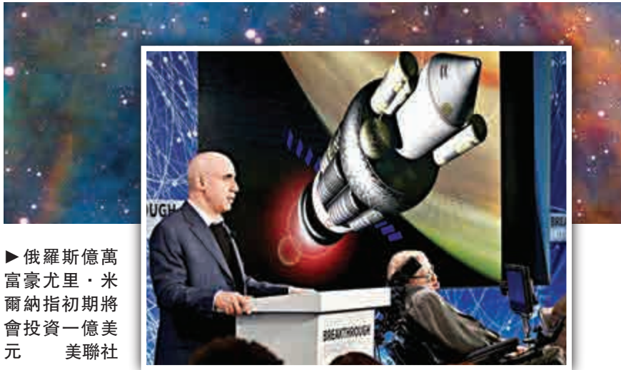
►俄羅斯億萬富豪尤里·米爾納指初期將會投資一億美元