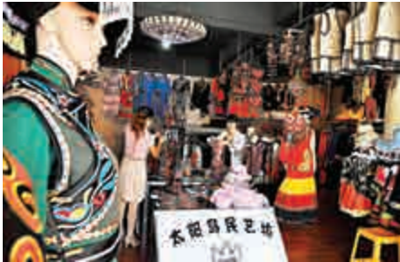
▲首季度八成開業小微企有收入。圖為貴州專售民族服飾的商店 資料圖片

【大公報訊】據中新社報道：國家工商總局新聞發言人于法昌表示，今年第一季度，內地小微企業活躍度提升，開業率達到71.4%。7362份有效調查問卷分析表