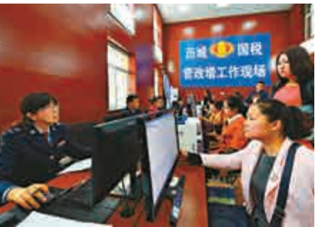
▲12日，山東濟南國稅局工作人員向納稅人發放增值稅發票

中，涉及的相關稅收問題及辦稅的流程、場所都保持不變。他同時指出，由於營業稅與增值稅計算方式不同，二手房交易營改增後稅負會略有降低。