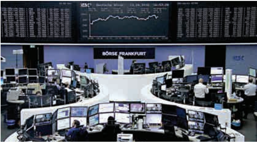
歐洲股市造好，德股昨亦漲逾百分之一；圖為德國法蘭克福證券交易所