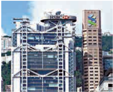
▲陳德霖冀銀行業提升企業文化和價值觀

陳德霖表示，金管局最近推出名為「平衡監管」措施，定期和銀行檢討監管過程中，一些可能出現的執行問題，並向銀行業界收集能夠精簡監管的意見。他相信，透過和業界保持良好和持續的溝通，長