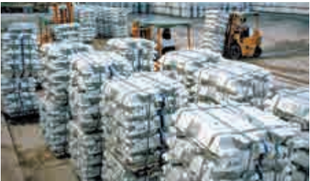
▲市場料美國加息步伐較慢，刺激商品類股份造好

摩通昨日發表報告唱好鋁價，建議長期持有鋁商品，但看淡銅價，擔心在供應增加的情況下，價格會下跌，到2018年第