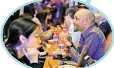
▲2017浙江·杭州國際人才交流與項目合作大會現場 資料圖片

儘管不少二線城市花盡心思「吸人」，但有專家卻認為，能留住人才、善待人才同樣不能忽視。山東大學教授王忠武認為，城市發展不能光「借外腦」，還要「練內功」，要想真正招得進，留得住人才，還應從提升城市的核心競爭力、吸引力入手，提升城市環境品質，打造宜居的生態環境。