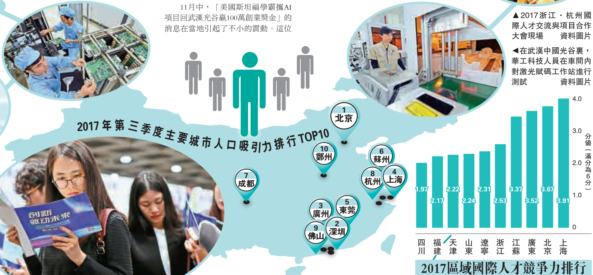
▲在武漢中國光谷裏，華工科技人員在車間內對激光賦碼工作站進行測試 資料圖片