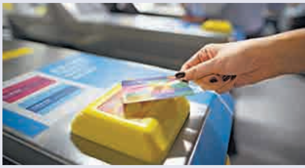
◀八達通獨佔局面將打破？

騰訊旗下的流動支付平台WeChat Pay HK昨日宣布，正式與港鐵簽署合作協議，本地乘客及內地旅客將來均可以透過WeChat Pay HK或微信支付「帶來簡單、安全及方便的流動支付體驗」。