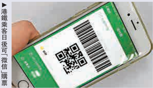
▶港鐵乘客日後可「微信」購票

八達通長期獨佔公共交通電子支付市場的局面即將打破！騰訊旗下的流動支付平台WeChat Pay HK，宣布與港鐵簽署合作協議，乘客將可用「WeChat Pay HK」或「微信支付」購票，計劃於12月中逐步試行。另外，隨着電子錢包逐漸融入社會，一項調查發現，近四成受訪者認為十年內香港便會成為「無現金社會」。