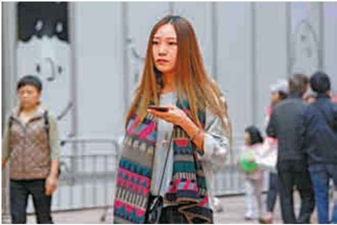
◀清涼多兩日，下周又暖返