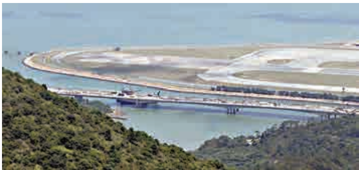
◀三跑統籌辦成立旨在監察及協調計劃落實 資料圖片

三個職位包括擔任統籌辦總監的首席政府工程師、擔任統籌辦首席助理秘書長的首長級丙級政務官職位，以及擔任統籌辦總助理秘書長的總工程師職位，將於明年4月1日期滿撤銷。