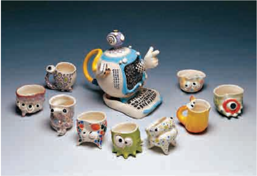
▲茶具文物館展出陶瓷茶具作品