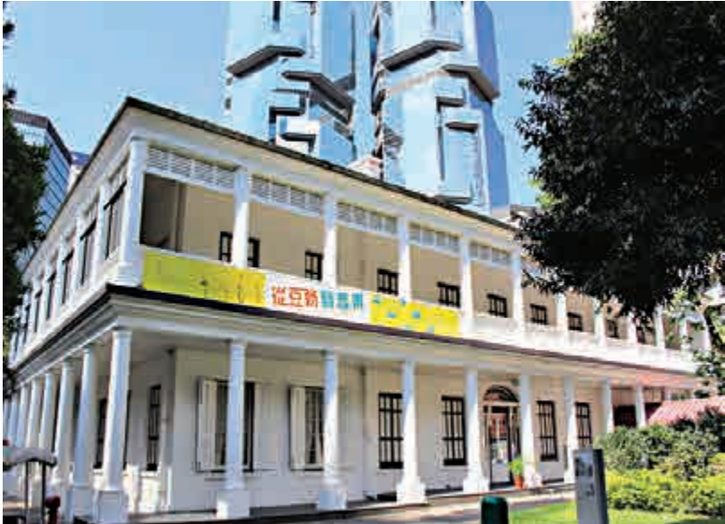
▲茶具文物館主要工作是保存、展出與研究茶具文物及有關的茶藝文化