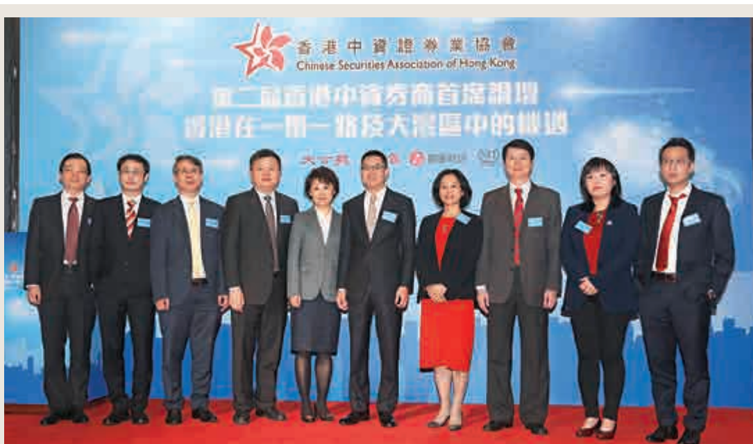
香港IPO承銷金額排名（美元）

他總結說，香港是全球經濟和中國經濟的紐帶，當全球經濟強勁復甦、中國內地經濟超預期下，香港的未來會更加燦爛。