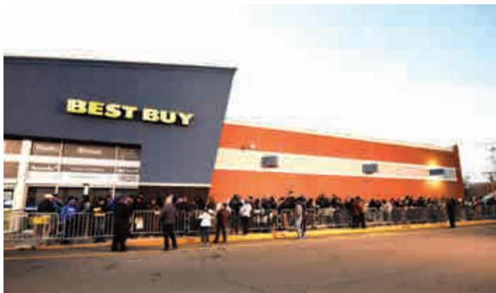
◀ 近年網購盛行，市民在感恩節前排隊搶買，熱情減退不少

今年環球經濟好轉，消費者和投資者信心回升，隨着道指今年升約19%，股價處於高水平，美國的企業縮減回購股份規模。INTL環球宏觀策略員稱，美國總統特朗普執政以來，企業營商信心上漲，對前景更為樂觀，企業高層傾向資本開支和併購的增長策略。美銀美林資料顯示，7月至9月期間評級高的非金融機構發債人的回購活動，連續第三個季度下滑。與此同時，這些企業的併購活動為年內最高水平。雖然企業回購股份速度放緩，但對股價沒有帶來衝擊，今年美國主要股市指數頻創新高。