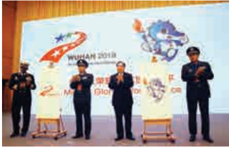
▲國防部發布第七屆世界軍人運動會會徽和吉祥物

國際軍事體育理事會主席艾爾西諾諾表示，對武漢的賽事籌備進度非常滿意，相信中國將令世界軍人運動會進入一個全新時代。