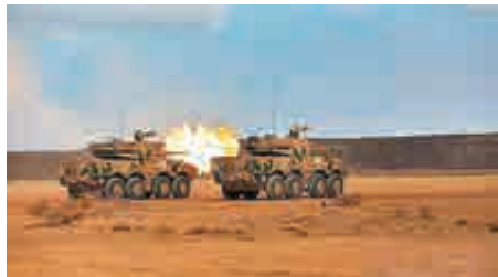
▲輪式裝甲突擊車實射穿甲彈

【大公報訊】據新華社報道：當地時間11月23日，解放軍駐吉布提保障基地組織官兵赴吉布提蓋伊德國家靶場組織火炮實彈射擊訓練，檢驗裝備各項戰術性能，