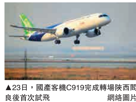
▲23日，國產客機C919完成轉場陝西閿良後首次試飛

【大公報訊】據央視新聞報道：23日，國產大型噴氣式客機C919首架機在航空工業試飛中心完成轉場陝西閿良後的首次試飛，飛機狀態良好。此次試飛也標誌着C919的為取得適航證而進行的試飛工作正式全面展開。