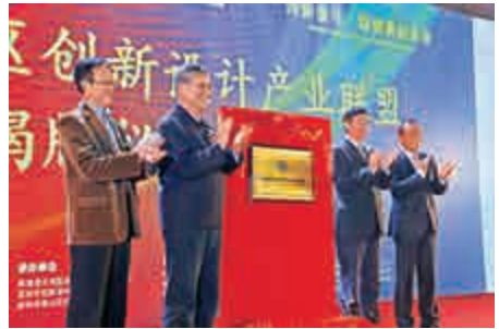
▲24日，粵港澳大灣區創新設計產業聯盟揭牌

圳市創新設計研究院、香港中文大學、中國科學院深圳先進技術研究院等以及粵港澳大灣區其他創新設計企業、科研院所、投資機構共計60多家機構發起組成。聯盟的成立，旨在加強粵港澳地區高校、科研院所與企業應用之間的對接和轉化，整合互聯網創新資源及科研成果，搭建技術及設計成果的聚合共享平台。