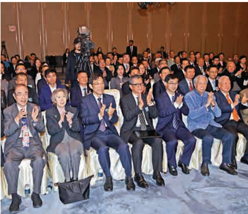
▲論壇以「實體經濟發展中的金融力量」為主題，吸引逾200名專業、金融界專家出席

最後，姜在忠提到《大公報》創刊115年來，堅持文章報國的辦報傳統，將自身發展融入國家與香港發展之中。香港回歸祖國以來更全力支持港府依法施政，積極為香港和內地的經貿合作搭建平台，服務國家「一帶一路」建設和企業「走出去」。他表明，《大公報》將繼續發揮傳媒集團優勢，團結廣大香港同胞，為「一國兩制」在港實踐行穩致遠譜寫新篇章。