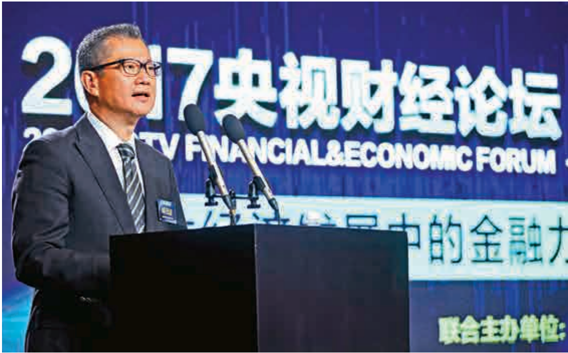
▲財政司司長陳茂波致辭時表示，讓香港成為內地市場和投資者與國際接軌的橋頭堡