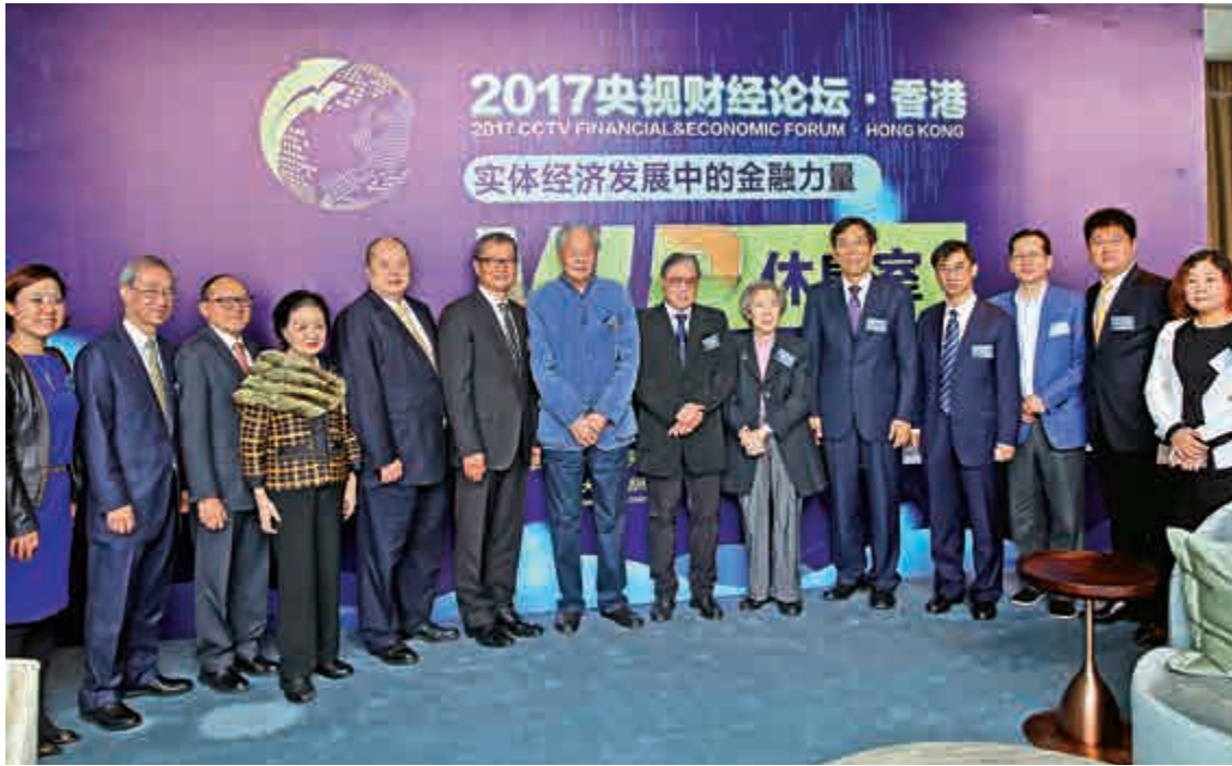
▲「2017央視財經論壇·香港」由《大公報》、大公網及中央電視台財經頻道共同主辦

由《大公報》、大公網及中央電視台財經頻道共同主辦的「2017央視財經論壇·香港」，昨日盛大舉行。今次論壇以「實體經濟發展中的金融力量」為主題，吸引逾200名專業、金融界專家出席，共同探討如何實踐國家主席習近平於十九大中提出，增強金融服務實體經濟的能力。財政司司長陳茂波在論壇上表示，創新科技帶動及全球經濟新格局下，不少新經濟企業採用「同股不同權」架構，對此香港亦不能落後，監管機構正研究相關安排，令香港上市平台與時並進。他又展望未來香港與內地可在「滬港通」、「深港通」及「債券通」的基礎上，進一步互聯互通，讓本港作為內地市場和投資者與國際接軌的橋頭堡。