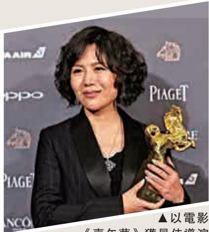
▲以電影《嘉年華》獲最佳導演獎的文晏