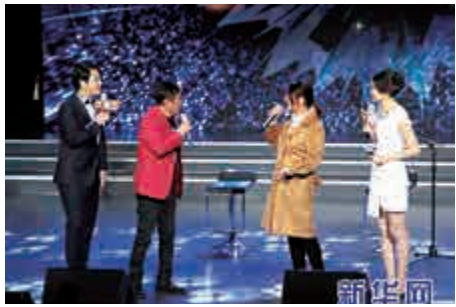
▲75歲的張帝（左二）和15歲的秦玥（右二）即興合作

澤等獻歌助陣。75歲的台灣「急智歌王」張帝，與來自大陸的年齡最小的獲獎選手、15歲的秦玥一展即興編唱的風采。兩位年齡跨度60年的即興合作，獲得了全場觀眾的掌聲。